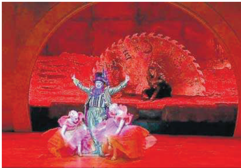
'El emperador de la Atlántida', de Viktor Ullmann.