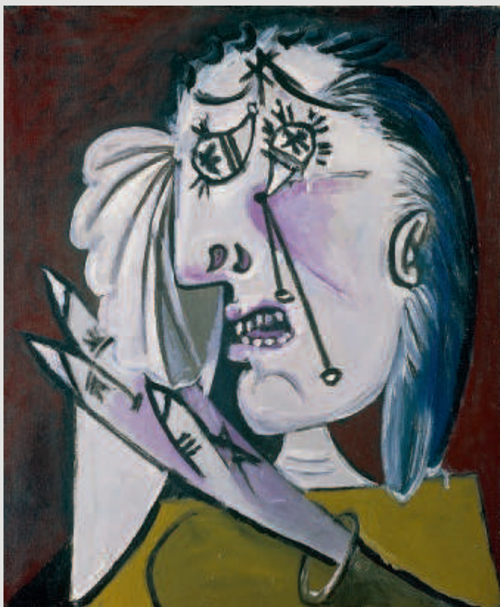
Pablo Picasso La mujer que llora , [27 junio] 1937. FONDATION BEYELER, RIEHEN/BASILEA, BEYELER COLLECTION © Sucesión Pablo Picasso, VEGAP, Madrid, 2018

Ligeti e Ysaye son los músicos elegidos por la coreógrafa que siempre impone la importancia musical en sus obras. Del primero, ocho estudios del piano, de Ysaye, tres sonatas para violín, sin la música en escena no sería lo mismo. Hoy última función de Rosas esta vez con una obra de 2017, «A love supreme». El ciclo Keersmaecker, termina así en Sevilla.