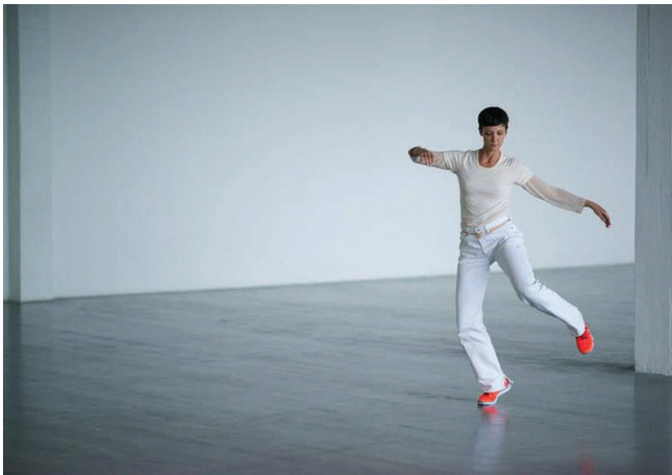
Sevilla rinde homenaje a la coreógrafa Anne Teresa de Keermaeker

Tres instituciones de la Consejería de Cultura rinden homenaje a la coreógrafa Anne Teresa de Keersmaeker con motivo del treinta aniversario de su compañía, con actividades realizadas por el Teatro Central, el Centro Andaluz de Arte Contemporáneo (CAAC) y el Centro Andaluz de Danza. (CAD).