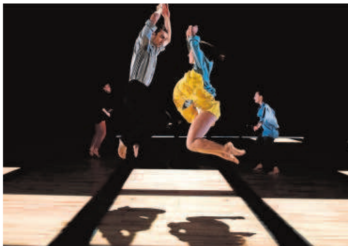
«Achterland», estreno en España en el teatro Central

Creada en el año 1990 en esta obra Keersmaecker les dió por primera vez un papel protagonista a los músicos haciendo que participaran en la escena. Además, introdujo hombres en sus montajes con lenguaje dancístico propio, tras a sus primeros trabajos realizados siempre con mujeres. Frente el rabioso feminismo de sus obras anteriores, en «Achterland» la tierra es de todos.