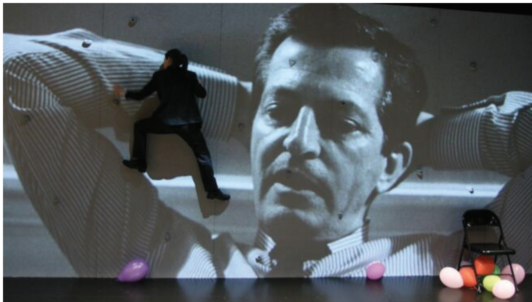
Una escena de 'Anatomía de un instante' dirigida por Àlex Rigola / Sílvia Poch

*** 'Anatomía de un instante' Heartbreak Hotel y Titus Andrònic S.L. en coproducción con Teatre Lliure y el apoyo de Teatro de la Abadía y del Departament de Cultura Generalitat de Catalunya. Basado en la novela de Javier Cercas, Anatomía de un instante . Texto: Javier Cercas y Àlex Rigola. Dramaturgia y dirección: Àlex Rigola. Intérpretes: Roser Vilajosana, Miranda Gas, Pep Cruz y Eudald Font . Escenografía: Max Glaenzel. Sonido: Igor Pinto. Iluminación: August Viladomat. Video: Amada Baqué. Construcción muñeco: Raquel Bonillo. Lugar: Teatro Central. Fecha: Viernes, 21 de enero de 2022. Aforo: Casi lleno.