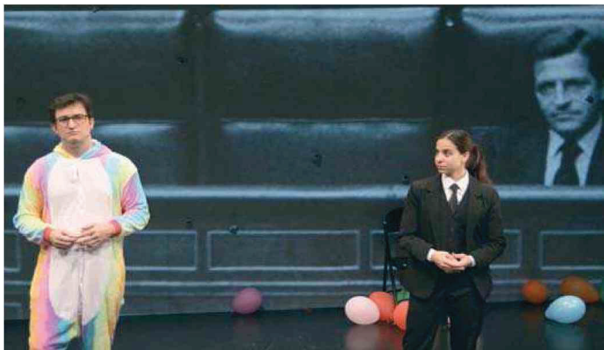
Un momento de la representación de '23F, Anatomía de un instante' que acogerá el Central.

Tanto Javier Cercas, que recibió por el libro los premios Nacional de Narrativa, el Terenci