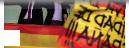
Abascal celebra los resultados con sus simpatizantes

Política de privacidad de DisqusPolítica de privacidadPrivacidad