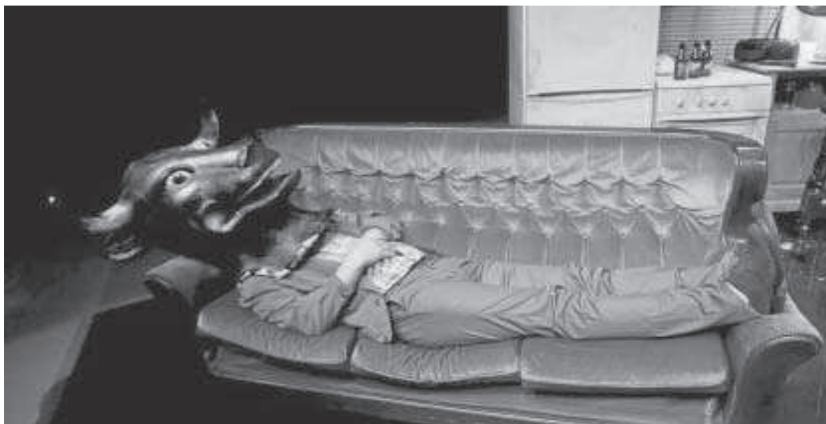
La compañía La Abducción es responsable del montaje de 'Los Mariachis'.

► Más 20 euros en 'tickets.jan-to.es' . Funciones a las 21:00