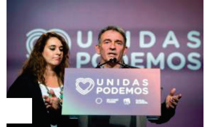
Unidas Podemos cree que tiene un «suelo muy sólido»