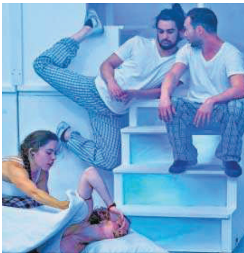
El insomnio constituye el núcleo principal de 'Vigilia'.

pretende llegar al corazón del público, cualquiera que sea su edad. La promesa hecha por unos niños en una casita colgada de un árbol se cumple veinte años después cuando, después de muchas