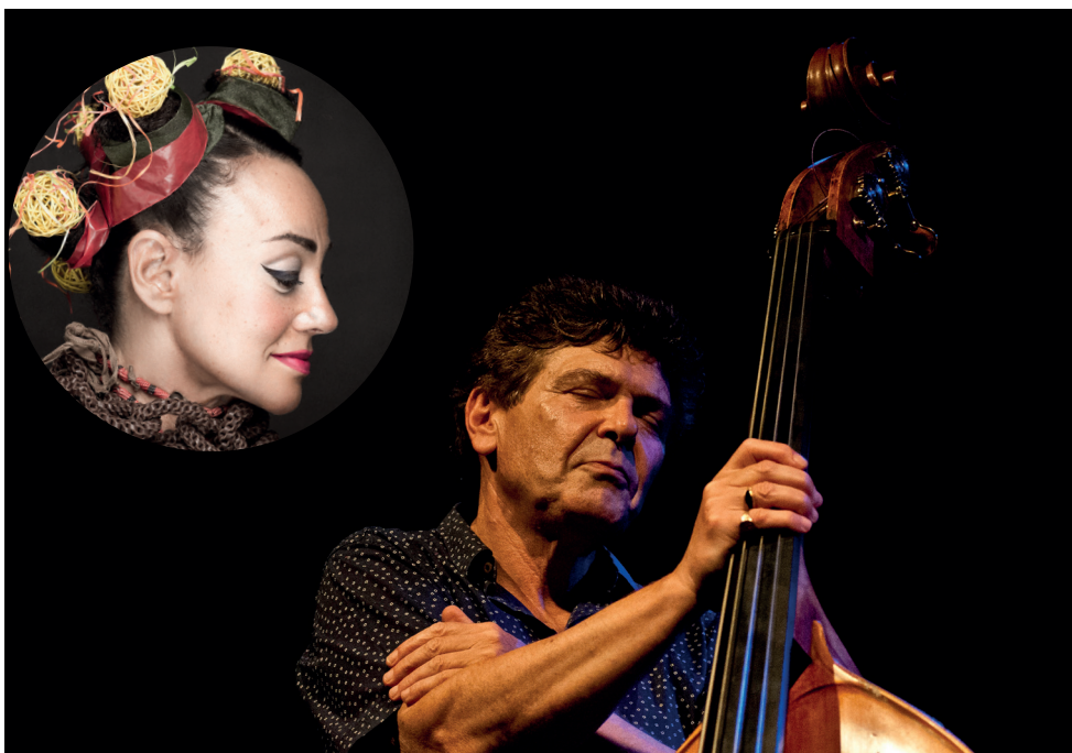
Carlos Bica