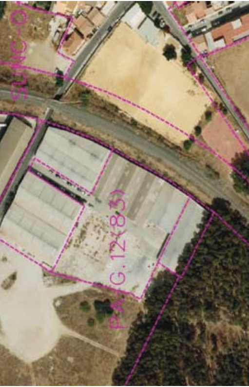
Identificación y Localización