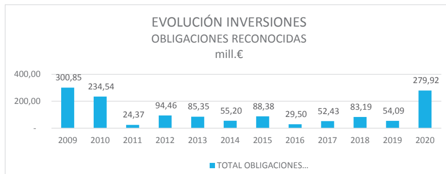
CUADRO EJECUCIÓN CAPÍTULO VI SAS 2009-2020

Esta prolongada disminución de la inversión se ha manifestado en unas carencias muy significativas en las infraestructuras sanitarias andaluzas y en los equipamientos de los distintos centros sanitarios. Construcción de centros sanitarios previstos, que no se han construido; ampliaciones y reformas de los ya existentes, que no se han realizado; falta de reposición de dispositivos médicos que han provocado un alto nivel de obsolescencia; todo esto había tenido como consecuencia un sistema sanitario público con una evidente necesidad de mejora y adaptación a las necesidades que merecen los profesionales sanitarios y la sociedad andaluza.