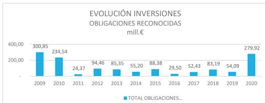
CUADRO EJECUCIÓN CAPÍTULO VI SAS 2009-2020

Esta prolongada disminución de la inversión se ha manifestado en unas carencias muy significativas en las infraestructuras sanitarias andaluzas y en los equipamientos de los distintos centros sanitarios. Construcción de centros sanitarios previstos, que no se han construido; ampliaciones y reformas de los ya existentes, que no se han realizado; falta de reposición de dispositivos médicos que han provocado un alto nivel de obsolescencia; todo esto había tenido como consecuencia un sistema sanitario público con una evidente necesidad de mejora y adaptación a las necesidades que merecen los profesionales sanitarios y la sociedad andaluza.