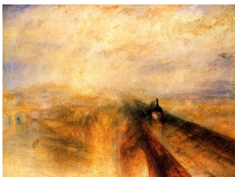
3A. W. Turner: Lluvia, vapor y velocidad . 1844.