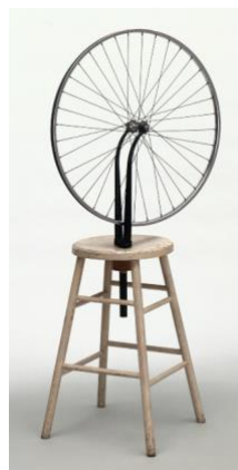
4B. M. Duchamp: Rueda de bicicleta . 1913.