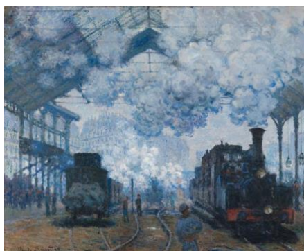
3B. C. Monet: La estación de Saint-Lazare . 1877.