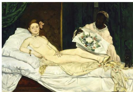
3B. E. Manet: Olympia . 1863.