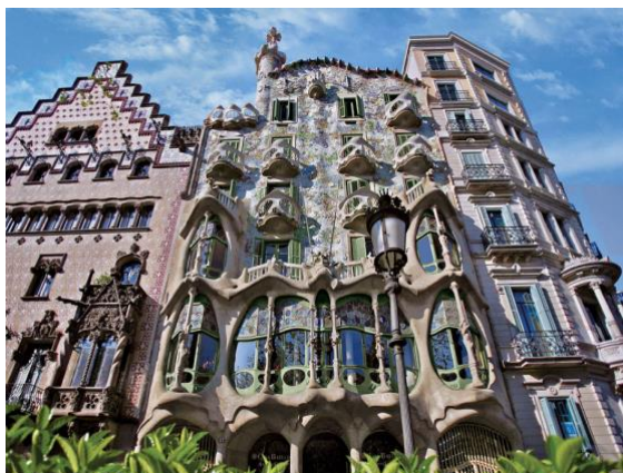
4A. A. Gaudí: Casa Batlló . 1904-1906.