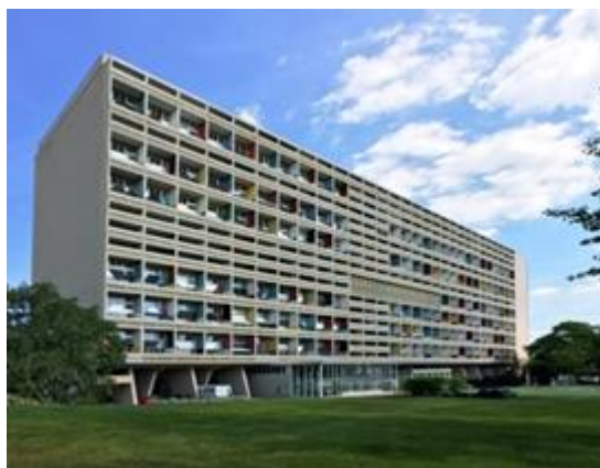
4B. Le Corbusier: Unité d'Habitation . 1947-1952.