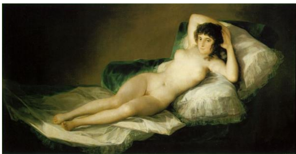
3A. F. de Goya: La maja desnuda . 1795-1800.