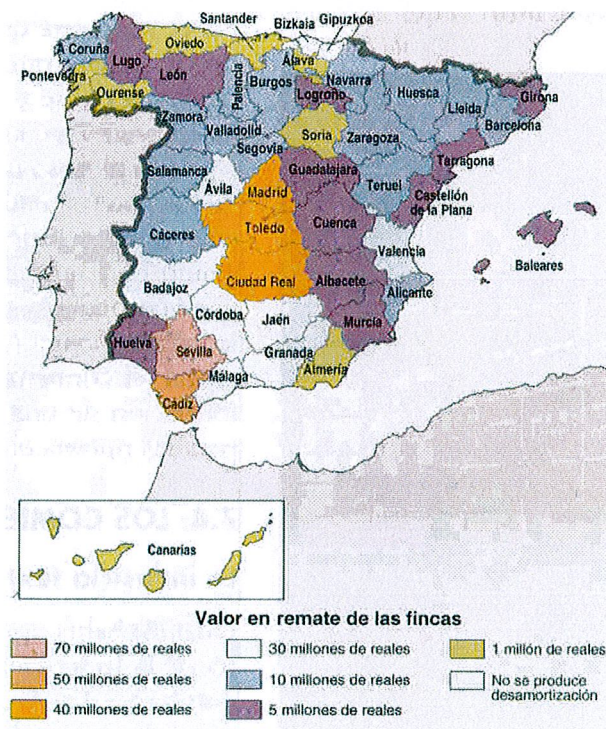
Mapa de la Desamortización de Madoz

En el Pardo a 19 de febrero de 1836. D. Juan Álvarez Mendizábal