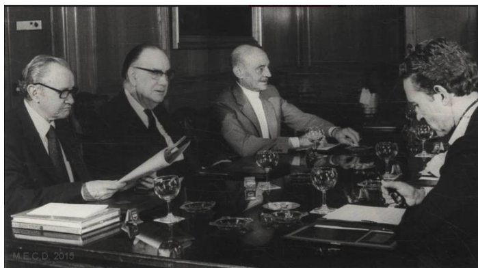
Imagen de Camilo José Cela.

José María Castellet, La hora del lector (Barcelona, Península, 2010)