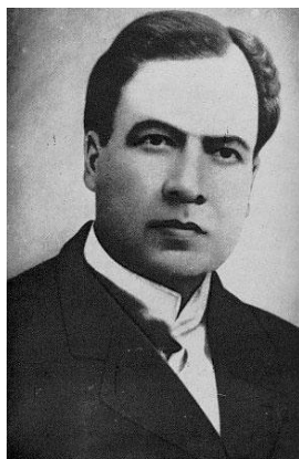
Retrato de Rubén Darío.

Donald Shaw, La generación del 98 (Madrid, Cátedra, 1977)