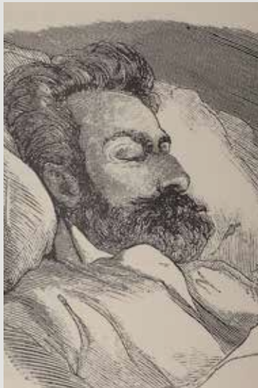
Bécquer en su lecho de muerte, en Obras , 1871.

mediados de 1871. Las estadísticas demuestran que el frío durante aquellos días fue muy intenso, y su débil cuerpo no pudo resistirlo.