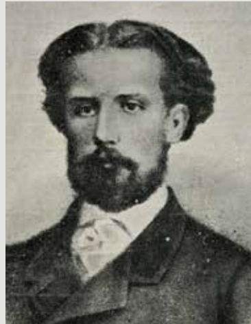
Retrato de G.A. Bécquer.

periodista, realizando en sus páginas las funciones más diversas, desde la de redactor de anónimos de sueltos a director en el último tramo de la publicación. En sus páginas aparecieron por primera vez una parte significativa de sus mejores escritos en prosa y hasta algún poema suelto.