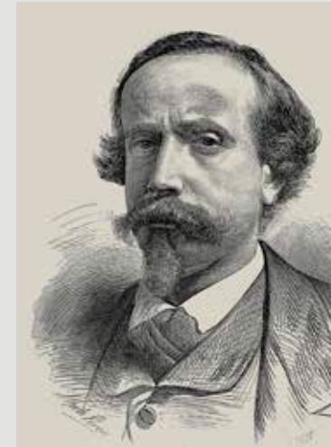
Retrato de Valeriano Bécquer.

La vida del poeta y la de su hermano Valeriano, sus estancias en Veruela, se han contado rodeándolas por un halo de fantasía. Se suman una supuesta conversión del poeta a la religión cristiana como si alguna vez hubiera estado lejos de ella, a su trato con brujas o la búsqueda apasionada de un tesoro. Durante los últimos años se han descubierto estas imaginaciones. Tras haber sido desamortizado y subastado, en parte quedó en manos del estado, abriéndose una hospedería en la celda del monasterio nuevo, construido en el siglo XVII. El gran empaque de sus construcciones, su aislamiento y su abandono, lo habían convertido en un lugar pintoresco al que acudían curiosos viajeros y a donde