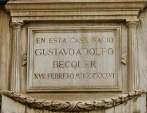
Lápida conmemorativa en la casa natal de Bécquer.