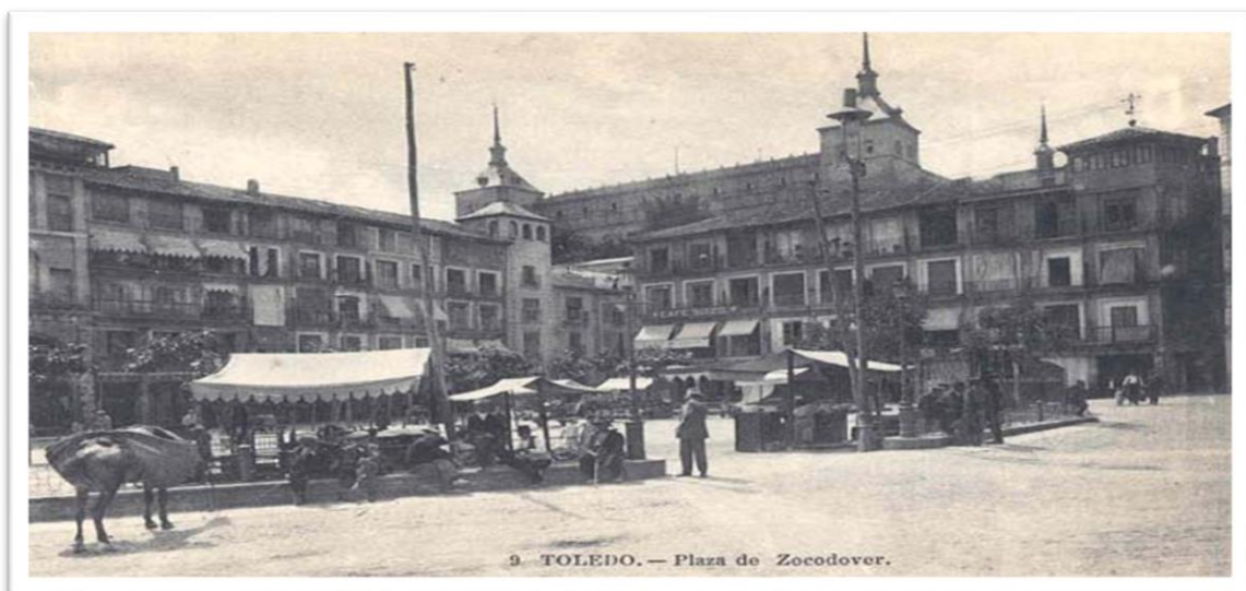
Toledo, plaza de Zocodover (fotografía de la 1ª mitad del siglo XX)