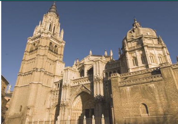
Catedral de Toledo (fotografía del siglo XXI)