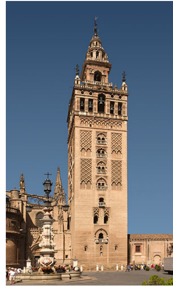
Fotografía D: