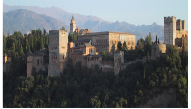
Fotografía B: de Elenea 94 bajo licencia CC BY-SA 3.0