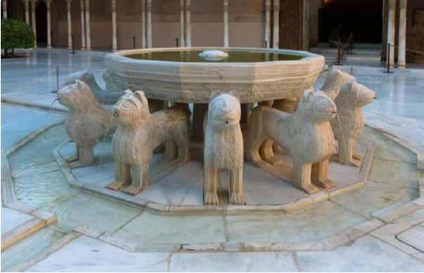
Fotografía A: