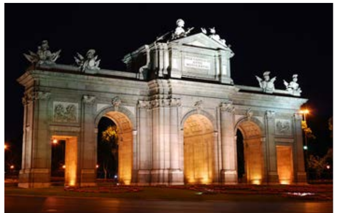
Fotografía F: de Emilio García bajo licencia CC BY-SA 2.0