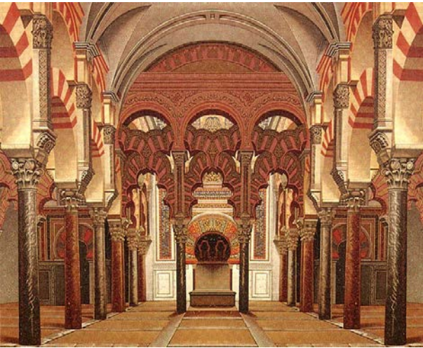
Fotografía C: