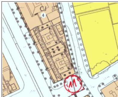
PLANO ORDENACIÓN PORMENORIZADA PGOU