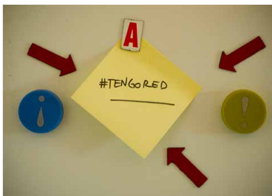
No estoy sola