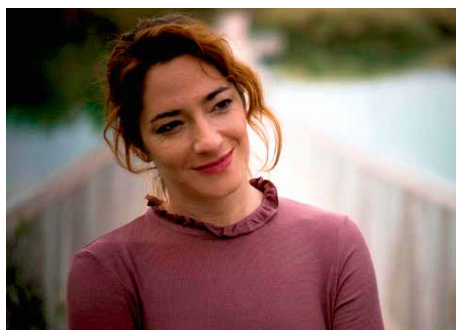
Vuelvo a ser yo