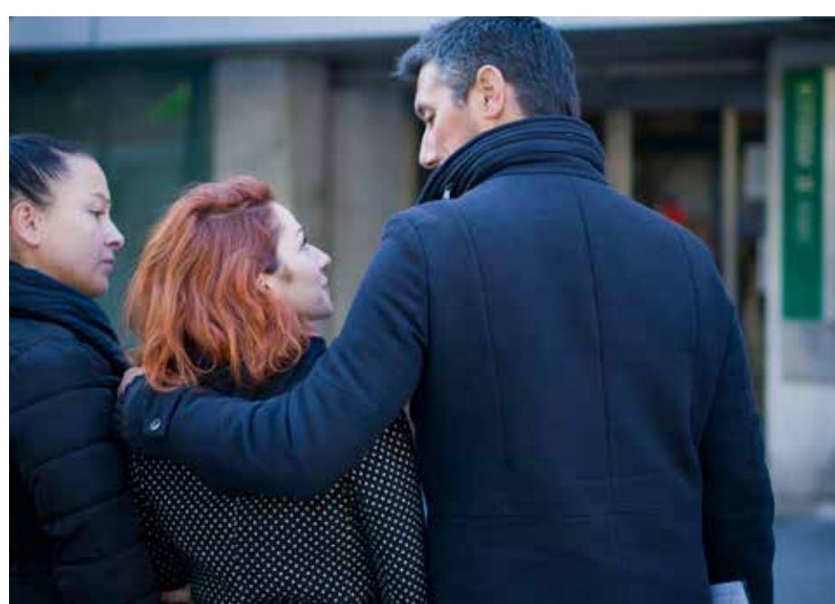
Gracias por ayudarme a dar el paso