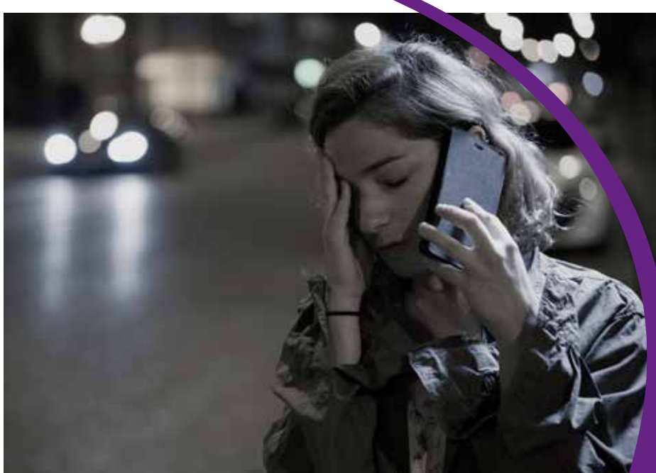
La llamada que me salvó