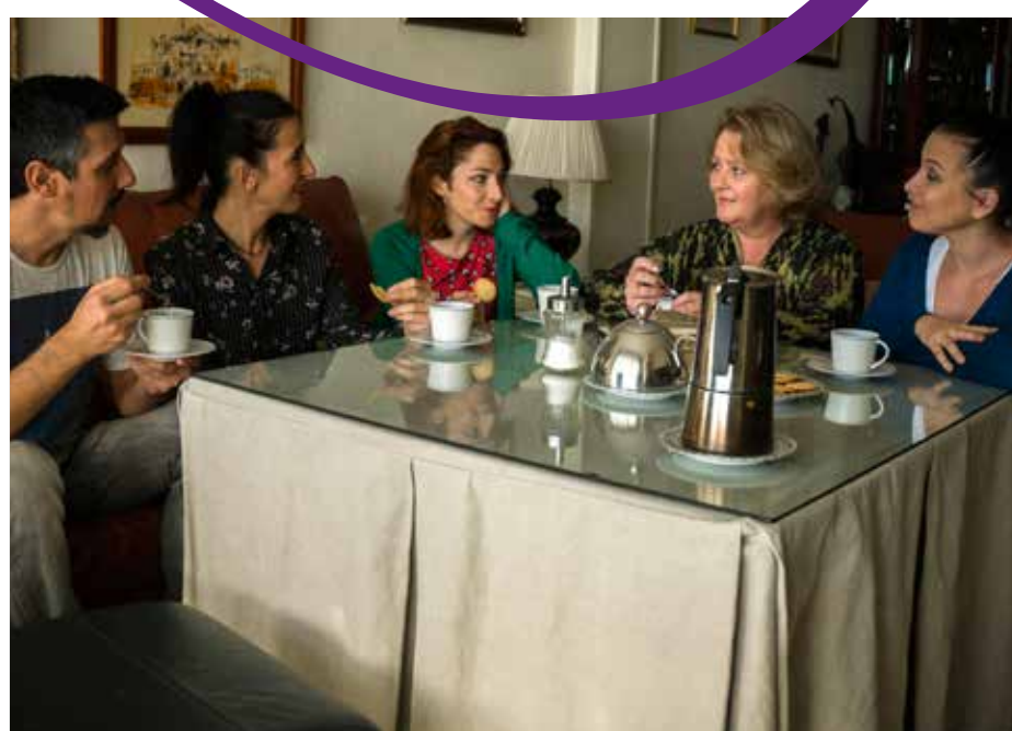
Con mi familia, con mi gente