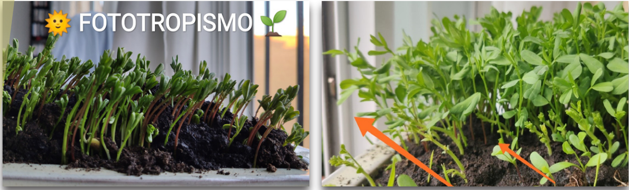
Observar forma parte del aprendizaje

Es lo que conocemos por Fototropismo , un movimiento natural y orgánico de las plantas en dirección a la luz. Esto se debe a la capacidad natural de una planta para cambiar de dirección según los cambios en la iluminación en el ambiente. Las responsables son las Auxinas , que tienden a concentrarse en la región del tallo y las hojas.