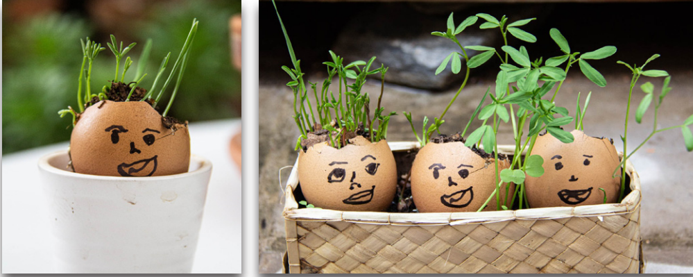
Utilización de cascarones de huevo como semilleros

TRUCO: la profundidad de siembra debe ser 2 o 3 veces el tamaño de la semilla. Así, un garbanzo se sembrará a mayor profundidad que una semilla de lenteja o de trigo.