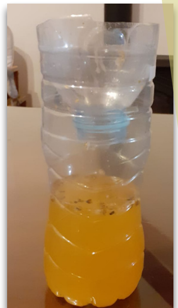
Trampas caseras para mosquitas de la fruta

¿Cuál os funciona mejor? ¿Atraen los mismos insectos?