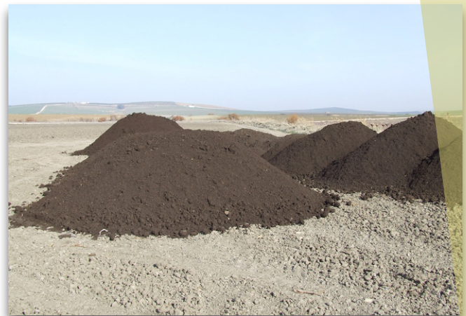
Experiencia de compost

Desde Andaluerto, con esta serie de fichas que hoy comenzamos sobre fertilidad y fertilización, os proponemos que dejemos de ver el suelo como un recurso a explotar, y empecemos a verlo desde una perspectiva más cercana a la cosmovisión que de él tienen numerosas culturas ancestrales. Ver el suelo como un ente vivo, que como tal se caracteriza, estando en nuestra mano cuidarlo, mejorarlo y alimentarlo... mejorando su fertilidad, porque su salud será la salud de nuestros alimentos y por tanto la nuestra propia.