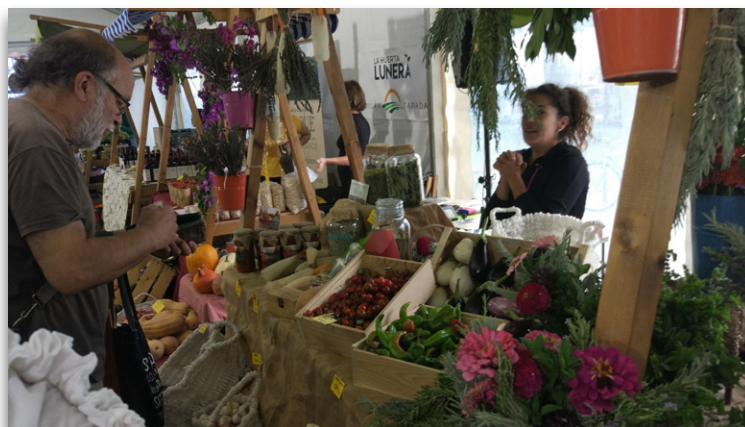
Ecomercado en Andalucía

La agricultura y ganadería ecológicas a pequeña escala suele tener como puntos de comercialización los ecomercados, los grupos de consumo, las tiendas especializadas o el comercio local. Sin embargo, actualmente los ecomercados se encuentran cerrados (hasta el comienzo de la Fase I del Plan de desescalada oficial, para cada provincia), los grupos de consumo han tenido que reorganizarse e incluso el comercio local en general ha visto cómo las limitaciones de movilidad, también ha condicionado sus posibilidades de acercar el alimento a las personas que consumen este tipo de productos.