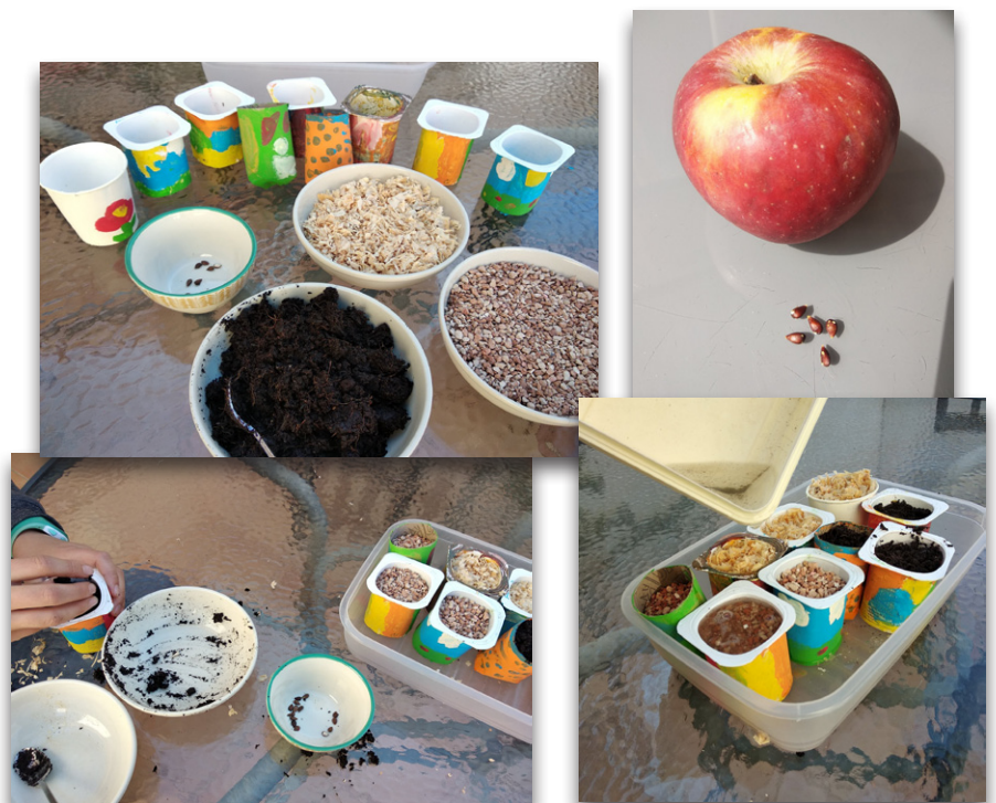
Elaboración de semilleros coloridos con envases reciclados de yogures

¿Qué pasa si no tenemos semillas en casa? Todos tenemos alimentos que nos pueden servir para la siembra, semillas de frutas y verduras (tienen que estar maduras para que hayan desarrollado la semilla: calabazas, manzanas...), o bien legumbres como garbanzos, lentejas, alubias o quizás maíz de palomitas, cualquier semilla nos puede alegrar ofreciéndonos una visión de sus brotes y desarrollo (las semillas duras como las de legumbres se recomienda ponerlas en remojo entre 12 y 24 horas antes de la siembra para que se hidraten y comiencen los procesos enzimáticos a actuar). Tras la siembra, un último riego para que la semilla quede bien pegadita al sustrato y, a partir de entonces, toca cuidar la plantita observar los cambios cada día.