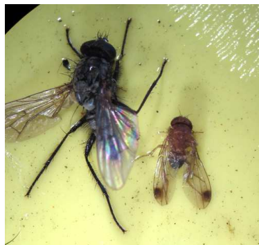
D.suzukii junto a mosca domestica en placa.

Mezclar bien y rellenar un tercio de la botella.