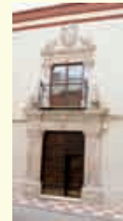
13. Casa señorial del siglo XVIII. Calle Priego, 42