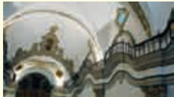
6. Iglesia de San Juan de Dios. Interesante arquitectura del siglo XVIII destacable por el diseño de su cornisa ondulante.