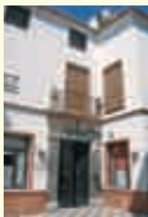
7. Círculo de la Amistad (antiguo Hospital de San Juan de Dios). Calle Cervantes, 1.