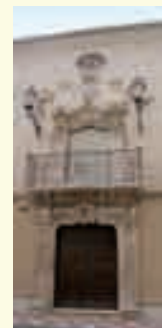
12. Casa señorial del siglo XVIII. Centro Filarmónico. Calle Priego, 32.