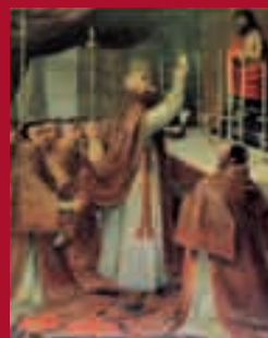
Misa de San Gregorio. Anónimo córdobes