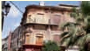
4. Edificio de ladrillo visto, siglo XVIII. Plaza Vieja.