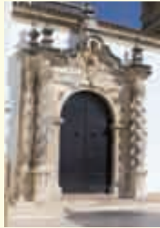
1. Parroquia de Nuestra Señora de la Asunción y Ángeles. (Sede de la exposición Andalucía Barroca).