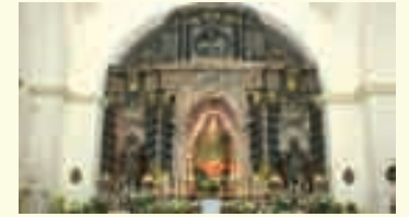
20. Ermita de Nuestra Señora de la Sierra.