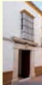
5. Arquitectura doméstica del XVIII. Calle José de Silva, 10.