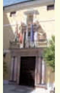
16. Colegio de la Purísima Concepción. Instituto de Enseñanza Media. Plaza de Aguilar y Eslava.