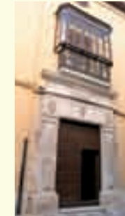
17. Casa señorial del siglo XVIII. Calle Martín Belda, 46.