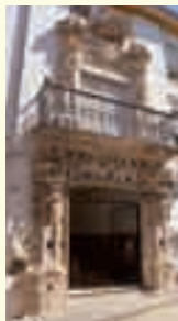
10. Casa noble del siglo XVIII. Calle Bachiller León, 8.