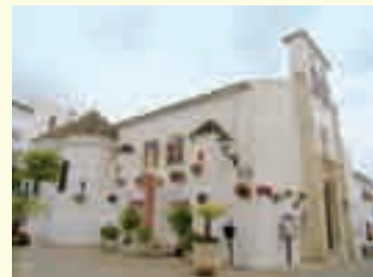
11. Iglesia de San Juan Bautista del Cerro. Destacamos su entorno urbano y conjunto interior.