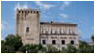
3. Antiguo Palacio de los Condes de Cabra.