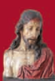
Ecce Homo. Torcuato Ruiz del Peral

EXPOSICIÓN ITINERANTE ANDALUCÍA BARROCA EN CABRA Del 19 de noviembre de 2009 al 10 de enero de 2010 Sede: Parroquia de Nuestra Señora de la Asunción y Ángeles Horario: Martes a Domingo: 10.00h a 14.00h / 17.00h a 19.00h Lunes: Cerrado