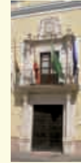
19. Casa noble del siglo XVIII. Conservatorio de Música y casa natal del novelista Juan Valera. Calle José Solís, 15.