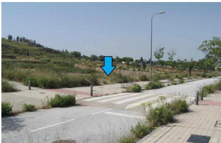
Vista de la parcela desde la calle Alcaide Alonso Arias de Herrera