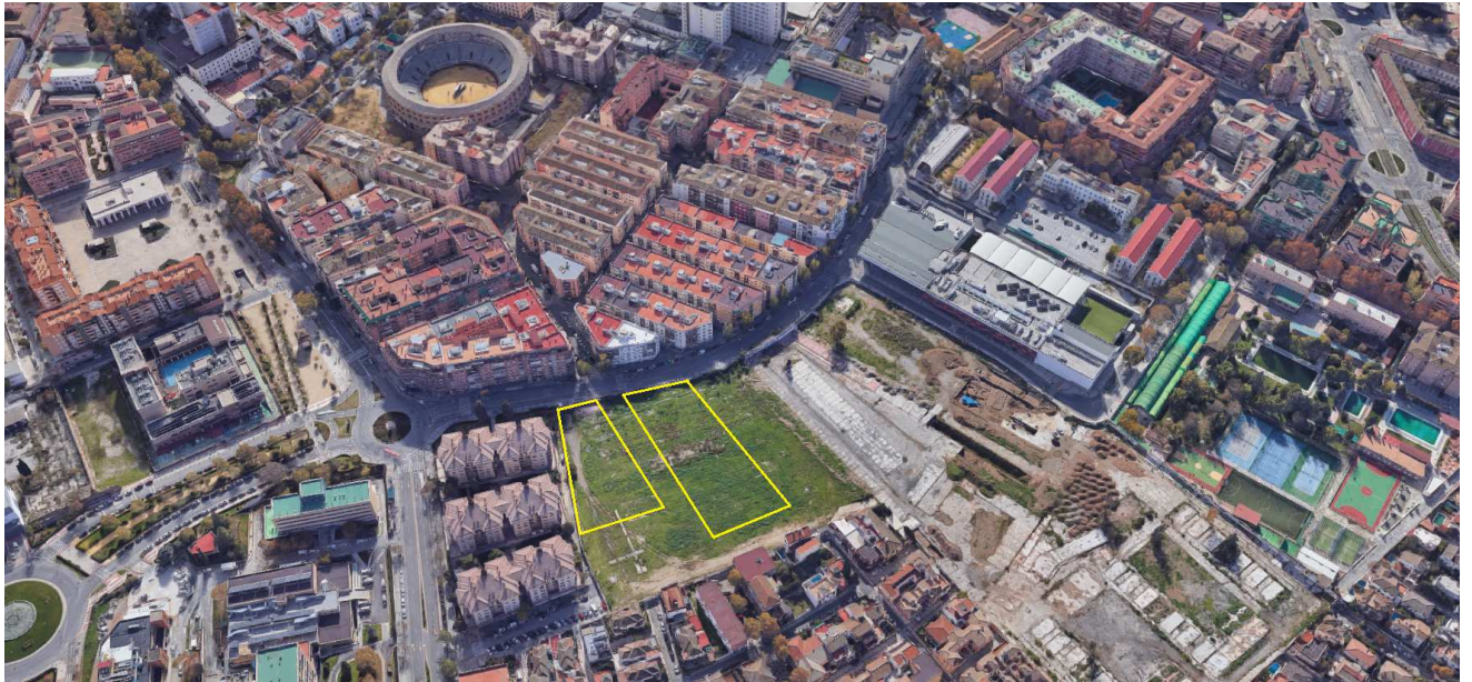
Vista de pájaro de ubicación de las parcelas en su entorno