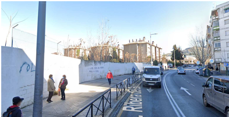
Vista desde calle Ribera del Beiro, extremo oeste