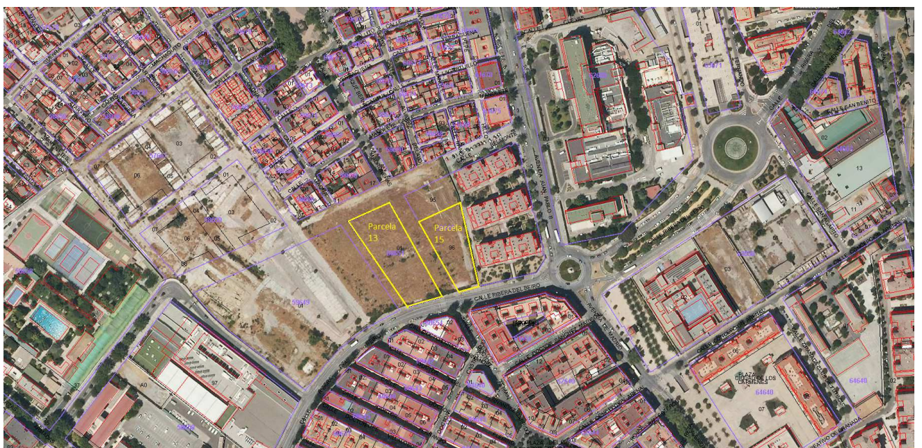
Vista aérea con ubicación en el parcelario catastral