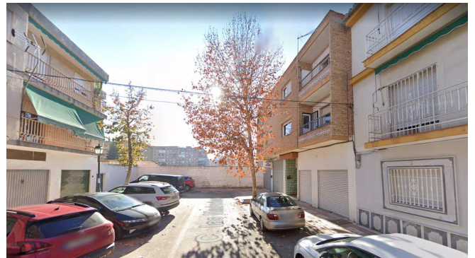
Vista del fondo de calle Madroñeros, que se prolongará dentro del area de reforma, separando las parcela 13 y 15