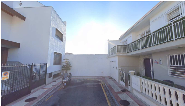
Vista del fondo de calle Garona, que se prolongará dentro del area de reforma, separando la parcela 13 de la parcela 20 de espacio libre