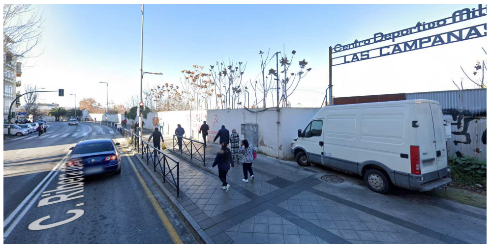
Vista desde calle Ribera del Beiro, extremo este: