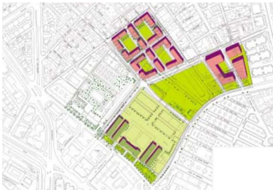
Imagen final de ordenación del AR-7-02 "Cuartel de los Mondragones"