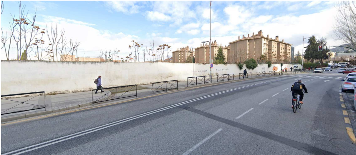
Vista desde calle Ribera del Beiro, esquina calle Dr. Enrique Hernandez