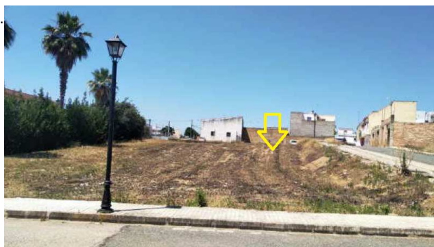
← Vista desde calle Vistula