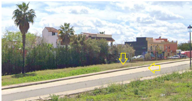
Vistas de la parcela desde calle Alhambra