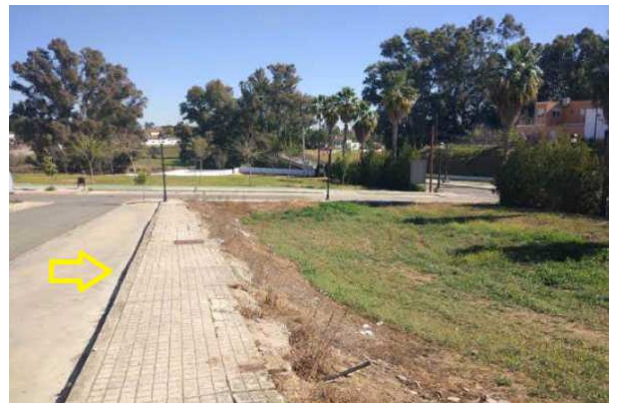
Vistas de la parcela desde calle Alhambra