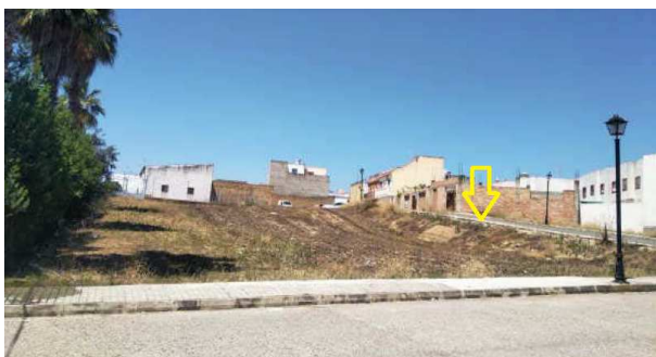
Vista desde calle Vistula