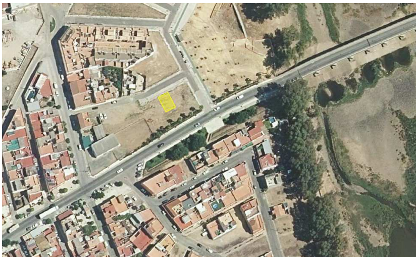
Vista aérea con ubicación de la parcela catastral