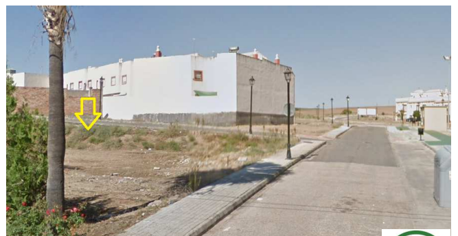
Vista de la parcela desde calle Vistula