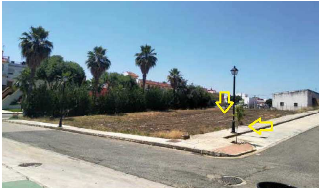
Vistas desde calle Alhambra