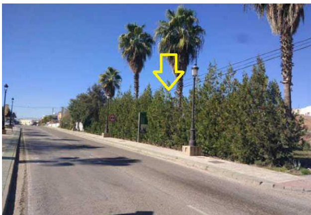
Ubicación fachada de la parcela en Avd. Alc. J. Padilla Burgos