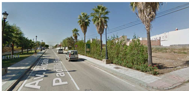
← Vista de la avda. Alcalde Justo Padilla Burgos y del entorno.