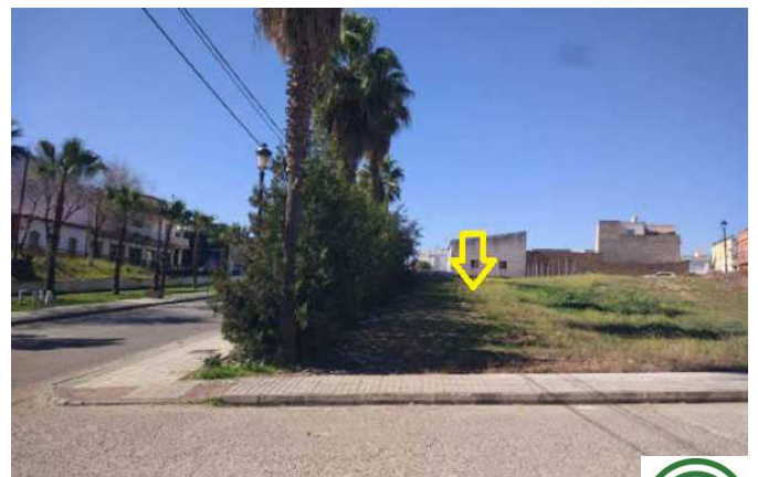
Vista de la parcela desde calle Vístula: