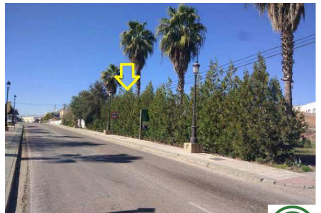
Ubicación fachada parcela en Avda. Alc. J. Padilla Burgos