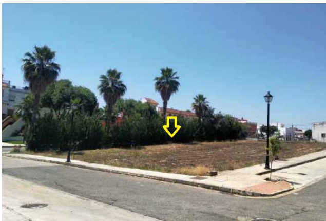
Vista de la parcela desde calle Vistula