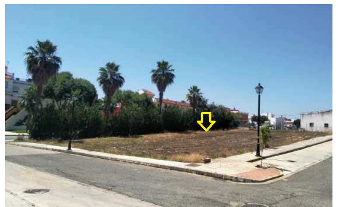
Vista de la parcela desde calle Vistula