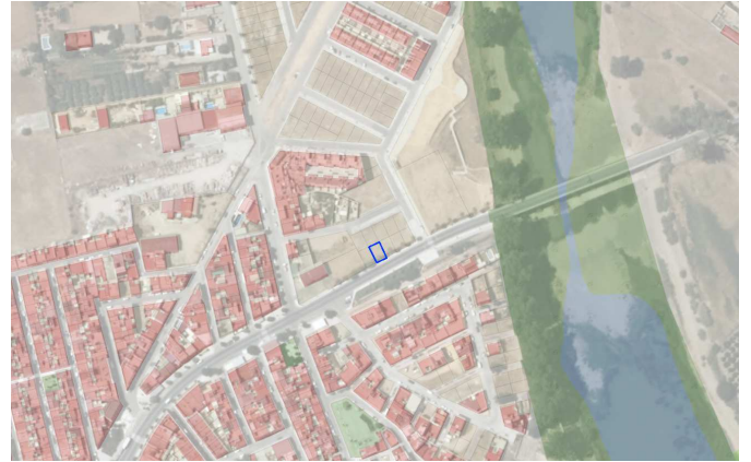
Ubicación de la parcela en el sector

Vista aérea con ubicación de la parcela catastral