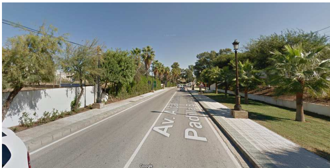
← Vista de la avda. Alcalde Justo Padilla Burgos y del entorno.