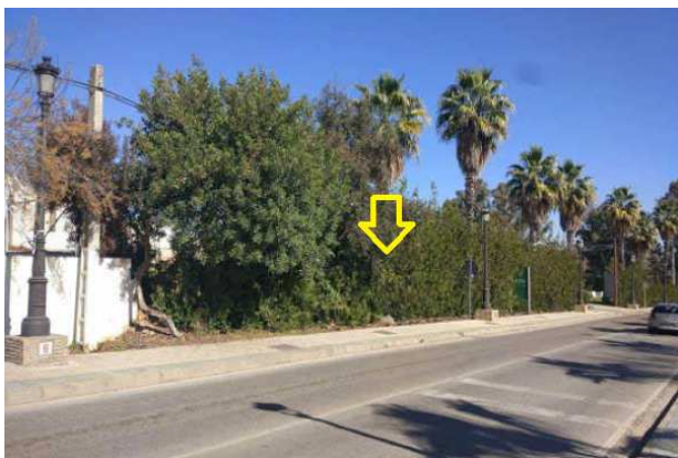
Ubicación fachada de la parcela en Avda. Alc. J. Padilla Burgos