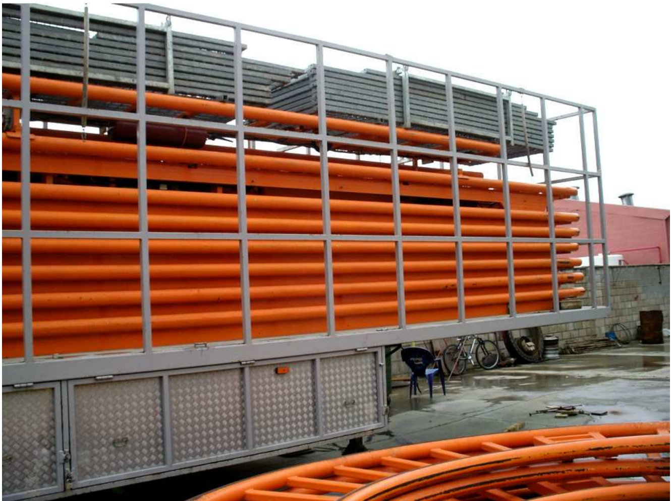
Imagen 1. Al no haber otro acceso, el trabajador intentó acceder al interior del remolque trepando por el exterior. En ese momento había una altura de cinco vías.