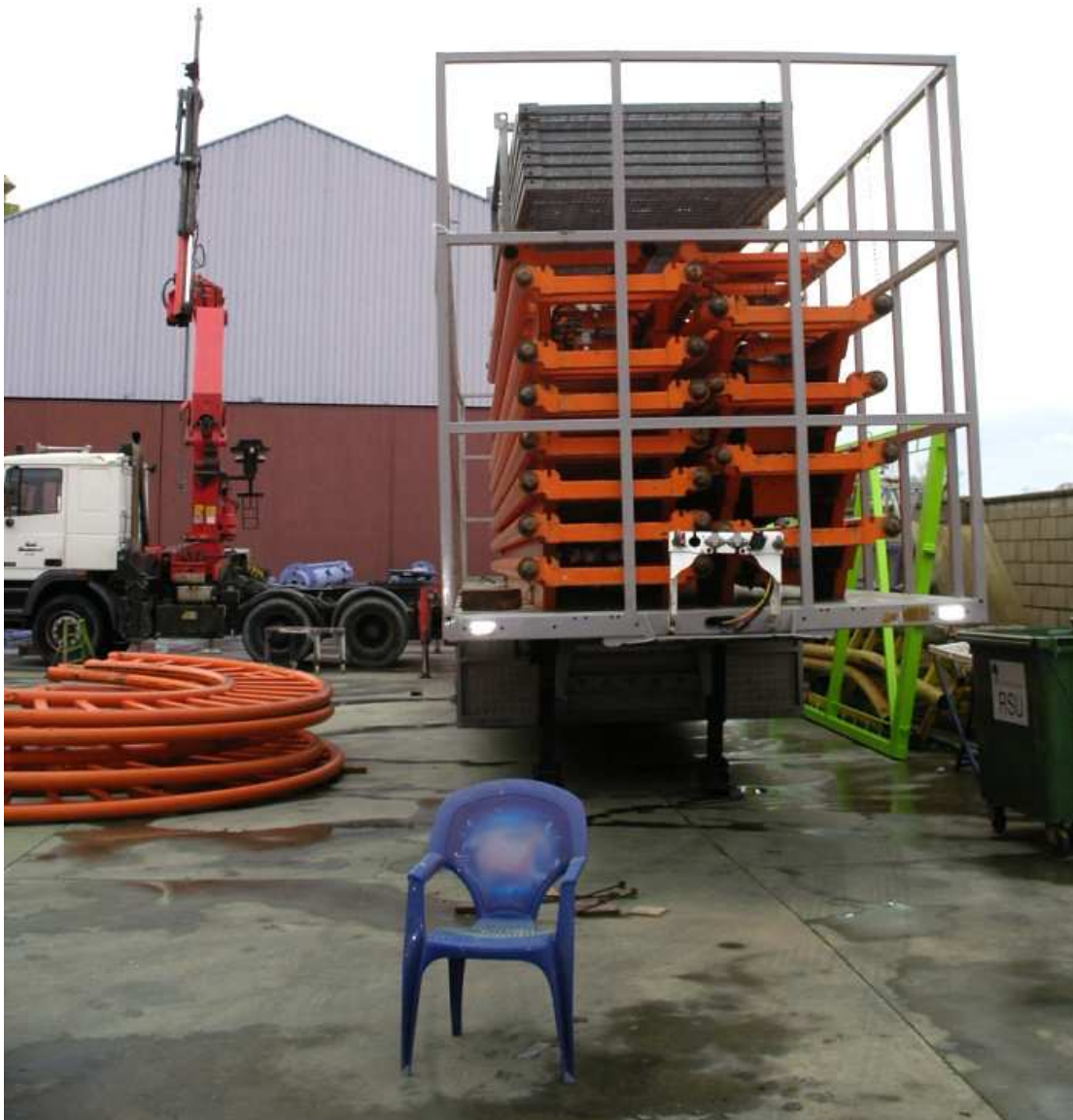
Imagen 2. El trabajador cayó desde la parte más alta de la estructura del semirremolque.

La empresa presentó un registro de entrega de información de riesgos laborales y de varios equipos de protección individual a los trabajadores, entre ellos un arnés de seguridad.