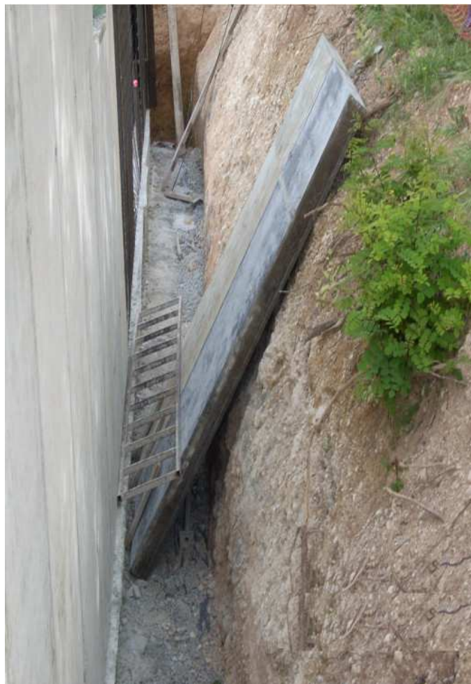
Imagen 2. Lugar donde fue atrapado el trabajador entre la pared del terreno y las dos placas de encofrado.

Estando ambos trabajadores realizando sus funciones en la obra, sin tener contacto visual con el accidentado oyeron un fuerte golpe en la parte externa del muro donde se encontraban los dos paneles. Los dos compañeros lo encontraron atrapado y aprisionado entre la pared del terreno y las dos placas de encofrado.