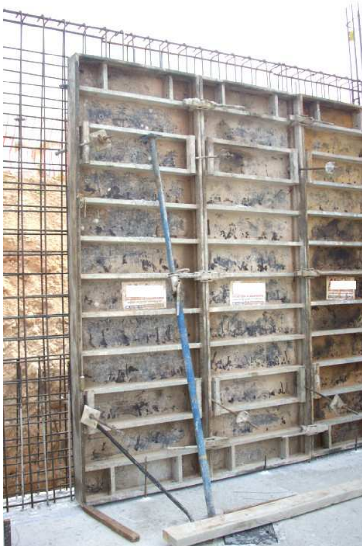
Imagen 1. Muro en construcción con panel de encofrado.