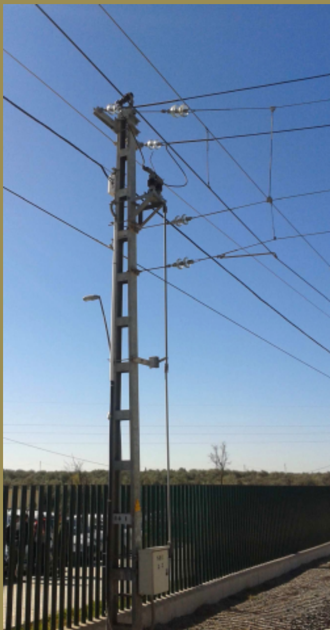
Poste donde se produjo el accidente. El trabajo se desarrollaba en horario nocturno.