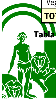
Tabla 2. Dispersión e incidencia de brucelosis bovina. Número de rebaños investigados, positivos y nuevos positivos en las comarcas ganaderas de la provincia de Córdoba.