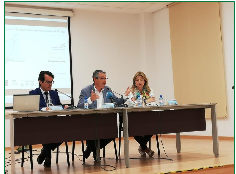
Figura 1.1: Desarrollo de la jornada participativa.

La jornada comenzó con una bienvenida a los asistentes y una posterior presentación del diagnóstico preliminar del Plan, donde se explicó de forma breve la situación actual socioeconómica de la población, el sistema de transporte en el área, los problemas detectados y los objetivos a alcanzar.