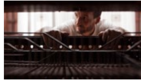
FINIS GLORIAE MUNDI p7 FINIS GLORIAE MUNDI