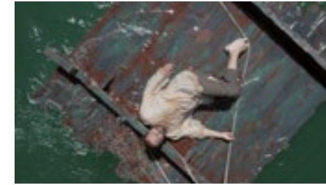
EL PRENAUTA p6 THE UNKNOWN PILOT