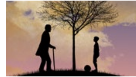
ORBIS p8 ORBIS