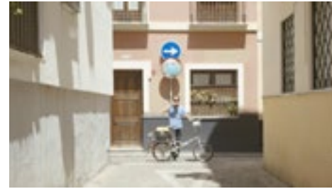
EL AFILAÓ p5 THE KNIFE SHARPENER