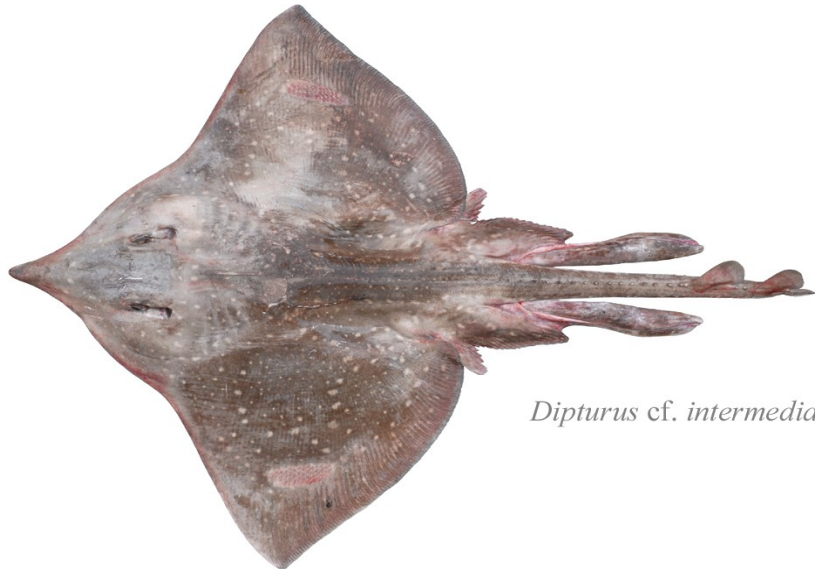
Dipturus cf. intermedia