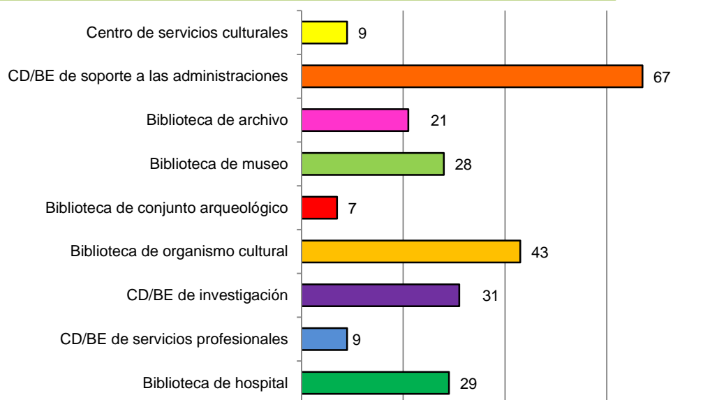
Gráfico 2. Número de centros de documentación y bibliotecas especializadas por tipología