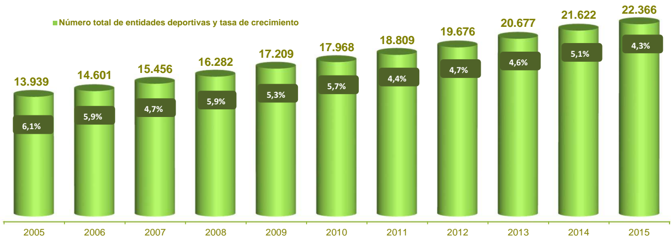
Gráfico 3. Evolución anual del número total de entidades deportivas registradas