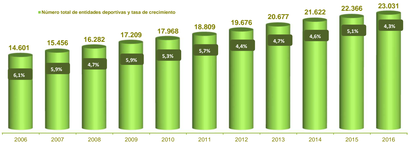
Gráfico 3. Evolución anual del número total de entidades deportivas registradas