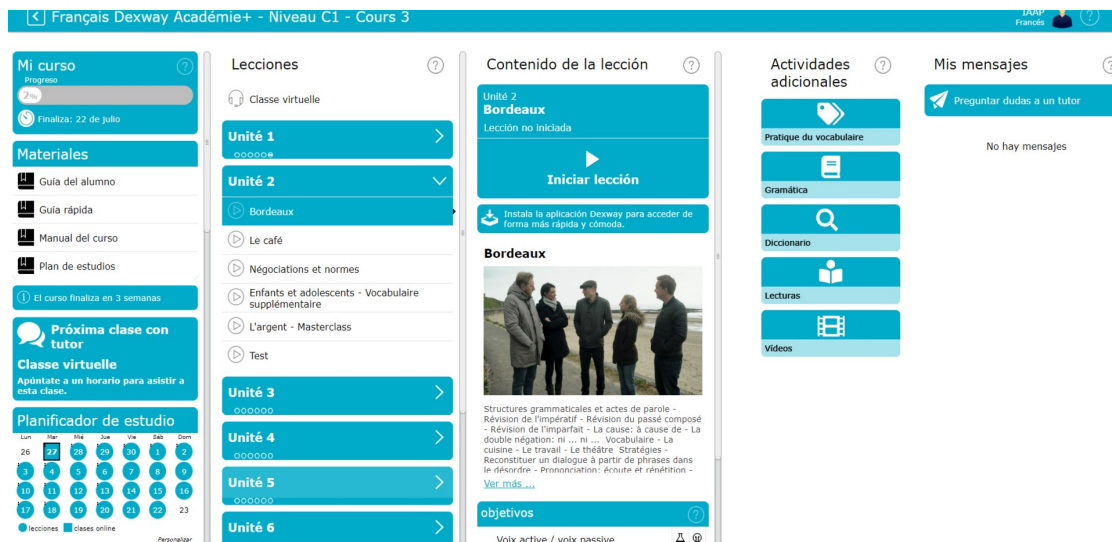
Imagen 1: Interfaz intermedio de Aula Intercultural

0.2 Cuando se hace mención al interfaz intermedio en el caso de estas dos entidades, se hace referencia a las siguientes visualizaciones: