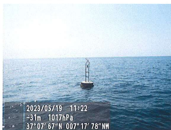
Baliza n.º 75