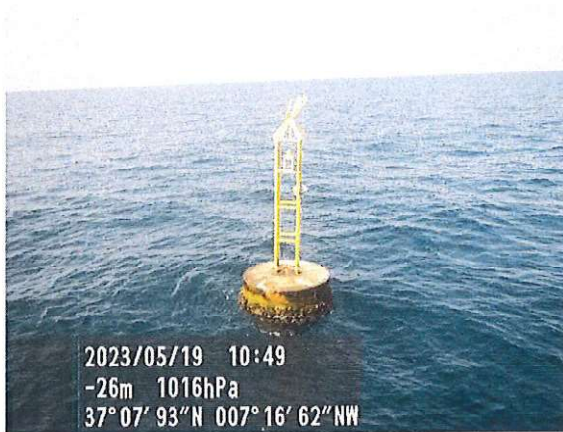
Baliza n.º 1

Fotos georeferenciadas de las boyas de delimitación de la instalación, parcela n.º 1, en base al esquema del acta de reconocimiento final de obras de 02/12/2020.