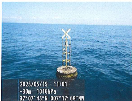
Baliza n.º 76

Fotos georeferenciadas de las boyas de delimitación de la instalación, parcela n.º 2, en base al esquema del acta de reconocimiento final de obras de 02/12/2020.