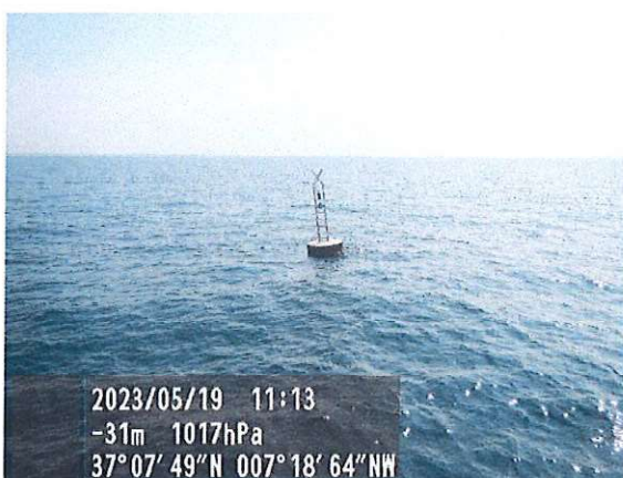
Baliza n.º 71