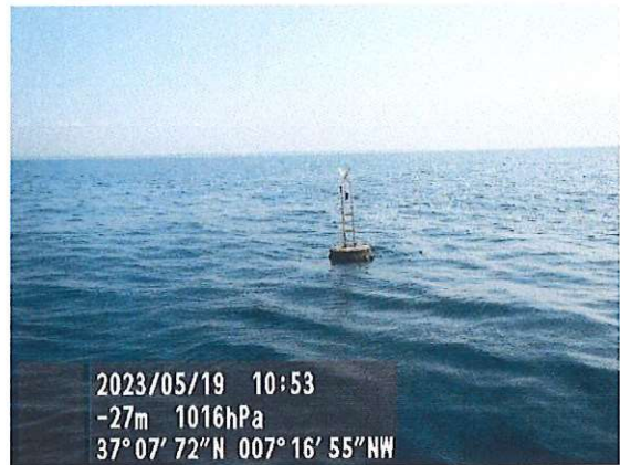
Baliza n.º 2