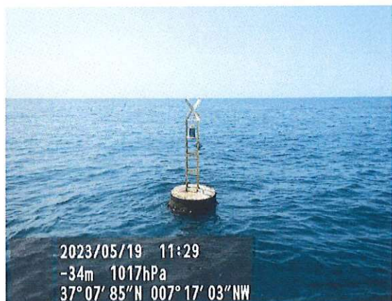
Baliza n.º 6