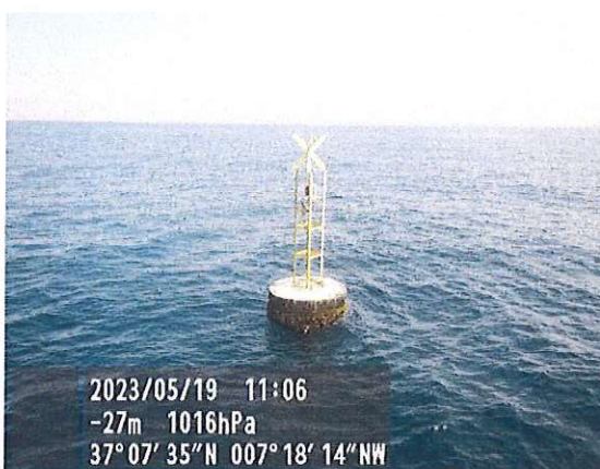
Baliza n.º 73