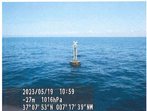
Baliza n.º 4