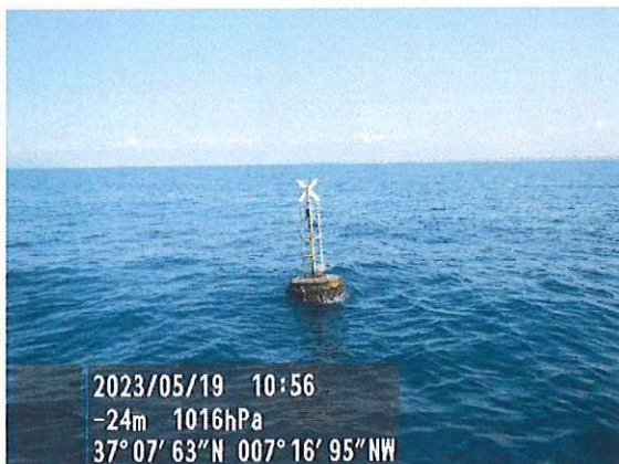
Baliza n.º 3