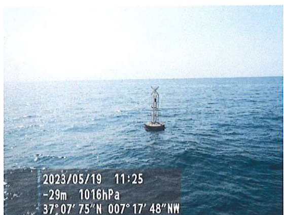
Baliza n.º 5