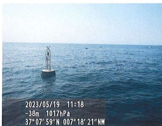
Baliza n.º 74