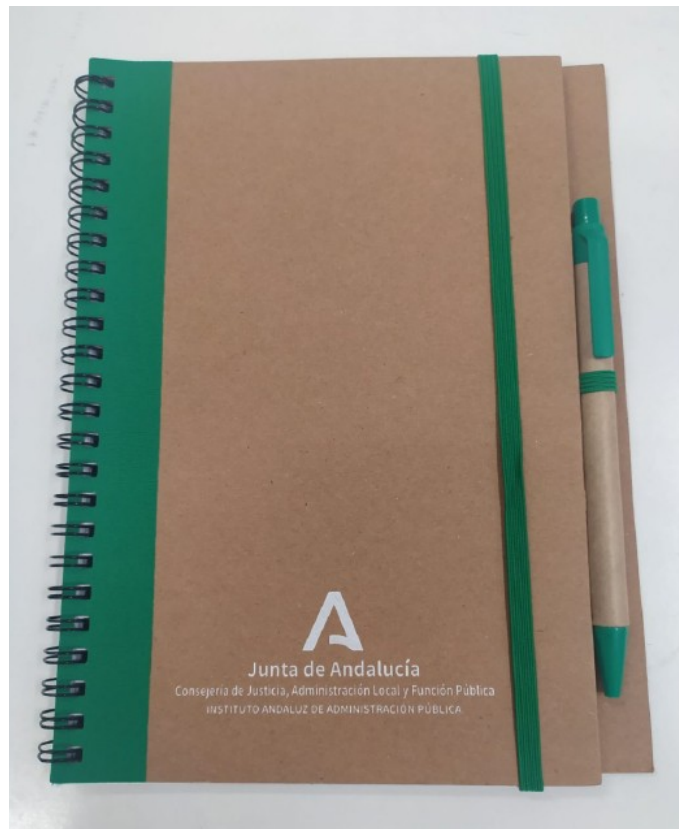
Imagen 04. Portada de cuaderno de cartón kraft serigrafiada, con bolígrafo serigrafiado

Cuadernos con portada y trasera de cartón kraft de 142x227, con impresión (blanca) en la portada, en la contraportada lleva incorporado un bolígrafo (también con impresión) alojado mediante una cinta elástica a esta. El encuadernado es con el sistema wire-o y esta formado por 50 páginas de gramaje mínimo 80 gr/m 2 . Cuenta con un cierre con la misma cinta elástica como se aprecia en las siguientes fotografías: