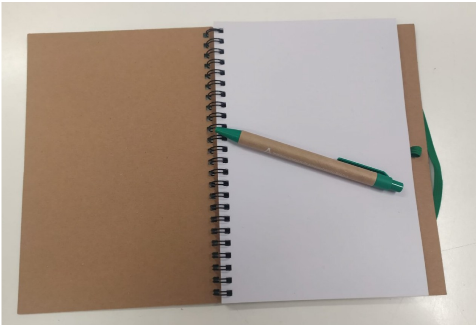
Imagen 05. Interior de cuaderno encuadernado es con el sistema wire-o

Al contrato se le asignan los códigos de clasificación de acuerdo con lo establecido en el Reglamento (CE) nº 213/2008 de la Comisión de 28 de noviembre de 2007 que modifica el Reglamento (CE) nº 2195/2002 del Parlamento europeo y del Consejo, por el que se aprueba el vocabulario común de contratos públicos (CPV), y las directivas 2004/17/CE y 2004/18/CE del Parlamento europeo y del Consejo sobre los procedimientos de los contratos públicos, en lo referente a la revisión del CPV, siguiente: