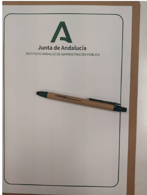
Imagen 03. Bolígrafo y cuadernillo con portada serigrafiada