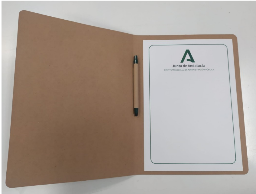
Imagen 02. Interior de carpeta de cartón kraft serigrafiada, con bolígrafo y cuadernillo con portada serigrafiada