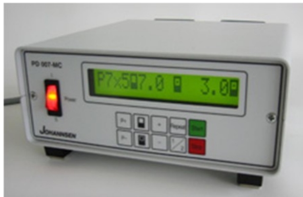
Consola de control

Nota: Las ubicaciones definitivas de sistemas y subsistemas se acordarán con el director/responsable de la instalación.