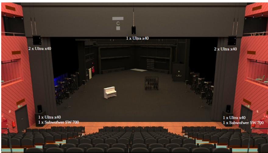
Configuración habitual de P.A.

Posición de mesa de P.A. habitual al fondo de la grada de público.