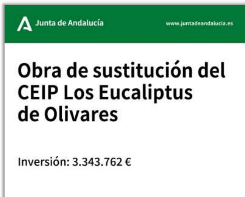
MODELO 1. CARTEL DE OBRAS NO COFINANCIADAS

NOTA: No existe modelo de placa para las obras no cofinanciadas. Las placas solo son obligatorias en actuaciones que reciben financiación de fondos europeos.