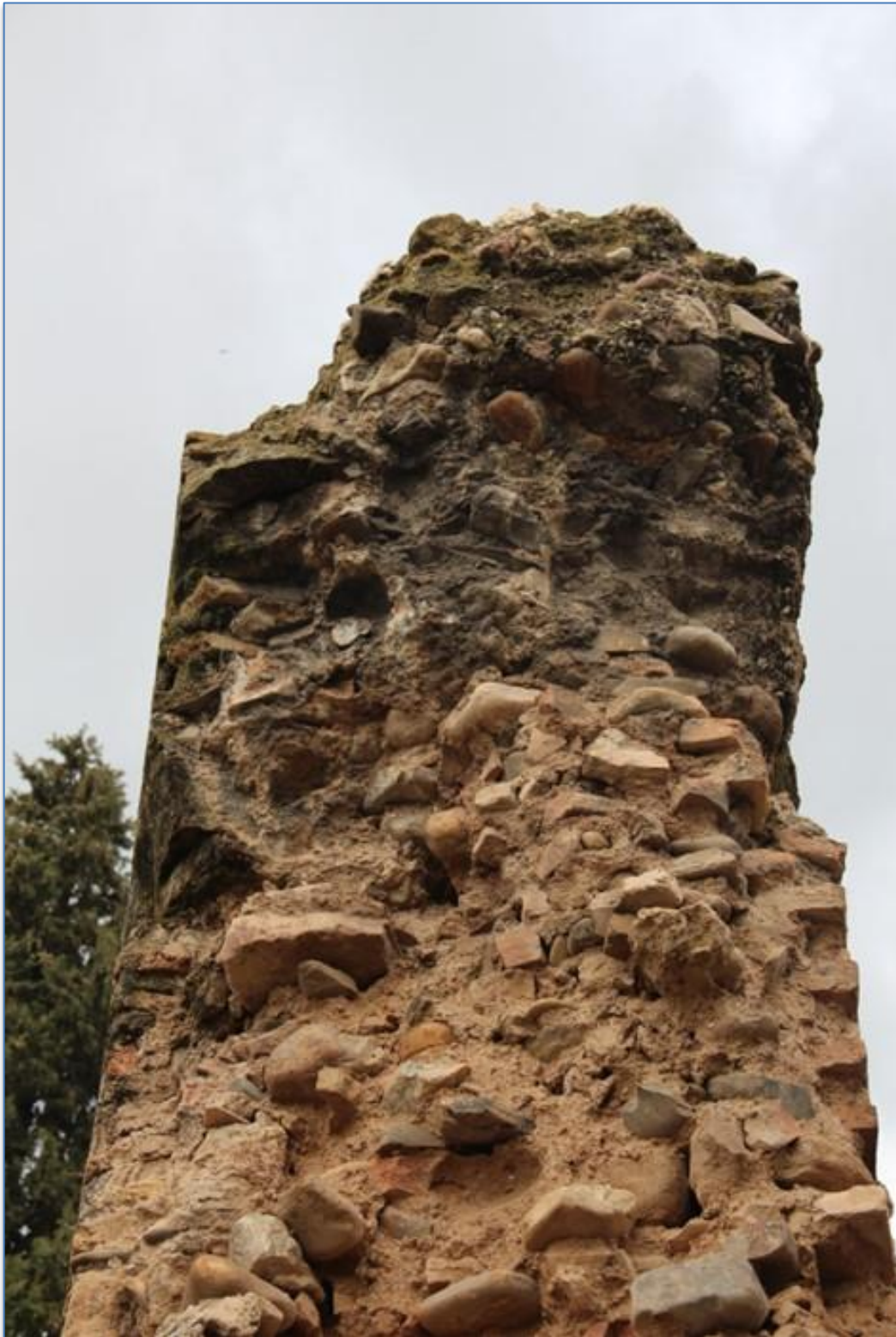
Detalle patologías y estado actual alzado este