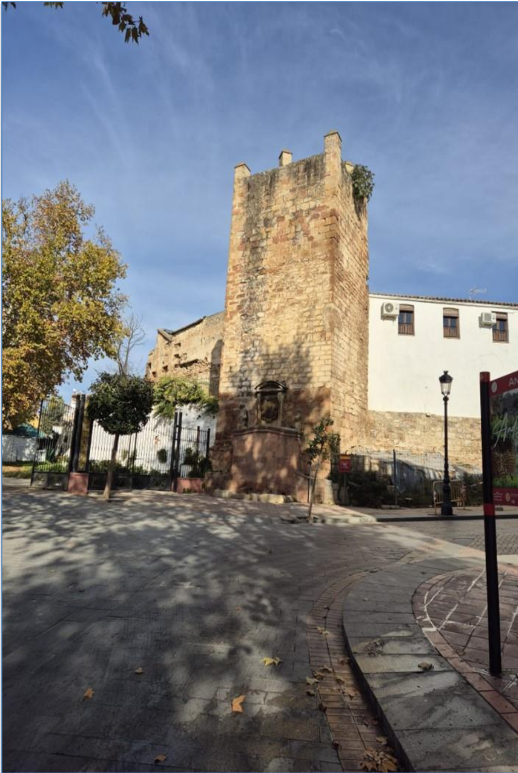
Entorno alzado sur