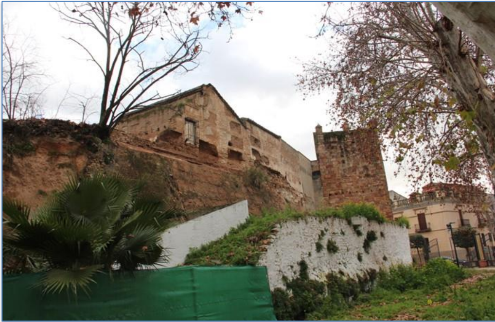
Entorno Torre de la Fuente Sorda alzado oeste