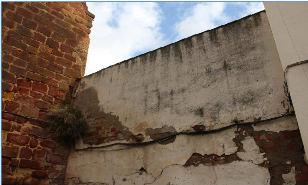
Detalle muro patio alzado oeste