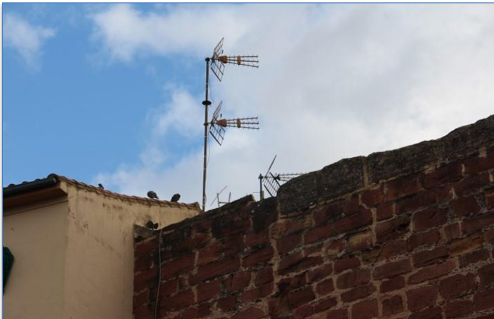
Detalle instalaciones próximas cubierta zona alzado oeste