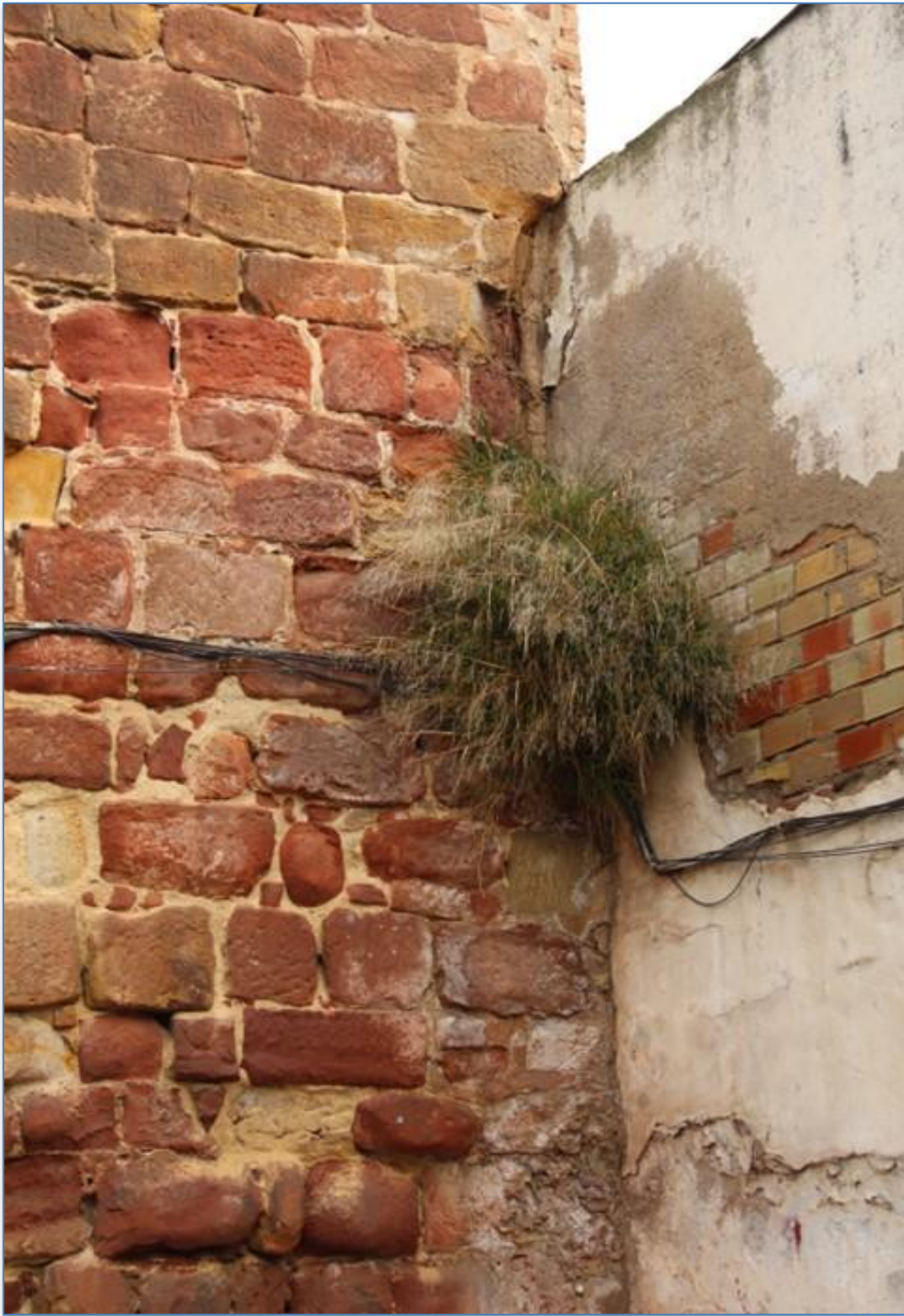
Detalle patologías vegetación alzado sur