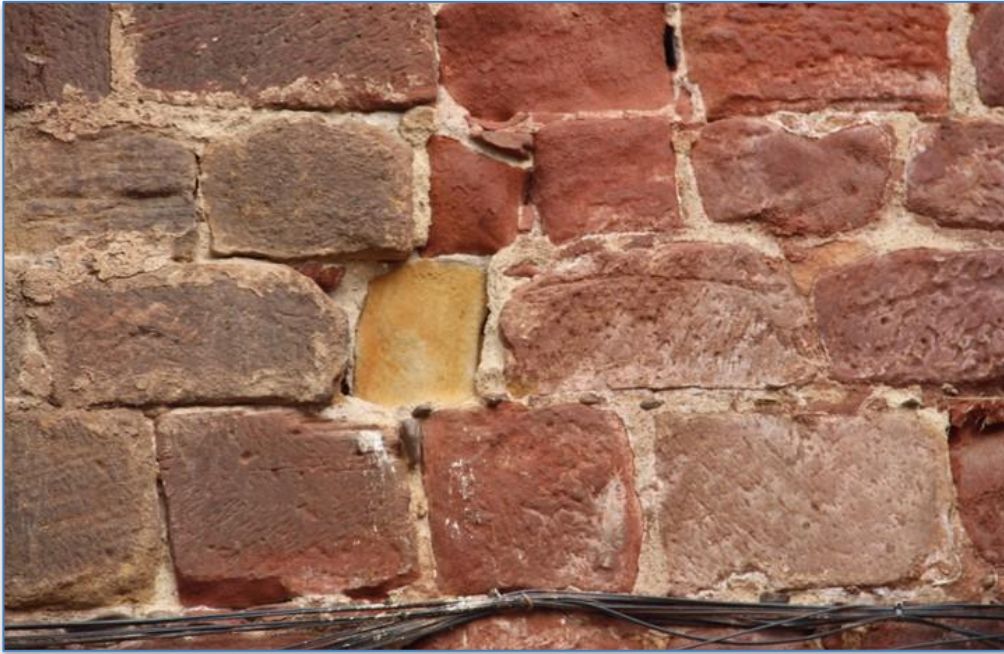
Detalle patologías en alzado oeste