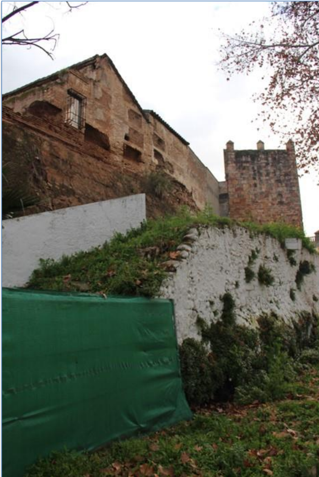
Entorno alzado oeste