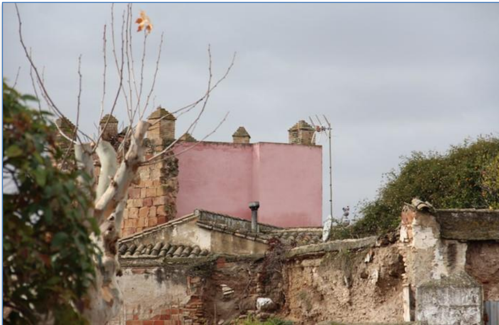
Detalle alzado alzado norte