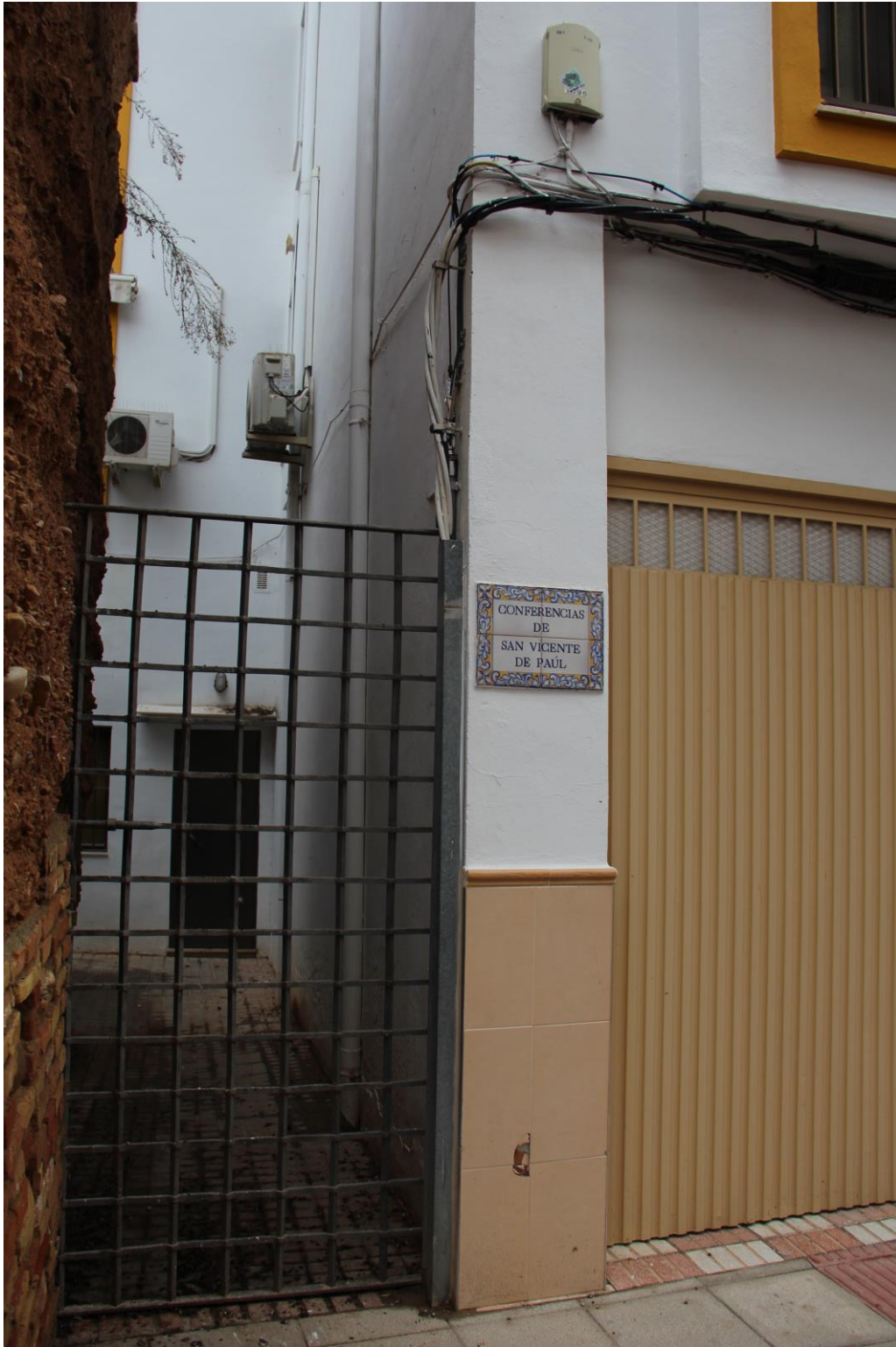
Detalle puerta acceso

Proyecto de Conservación de 4 Torreones del Conjunto Amurallado de Andújar