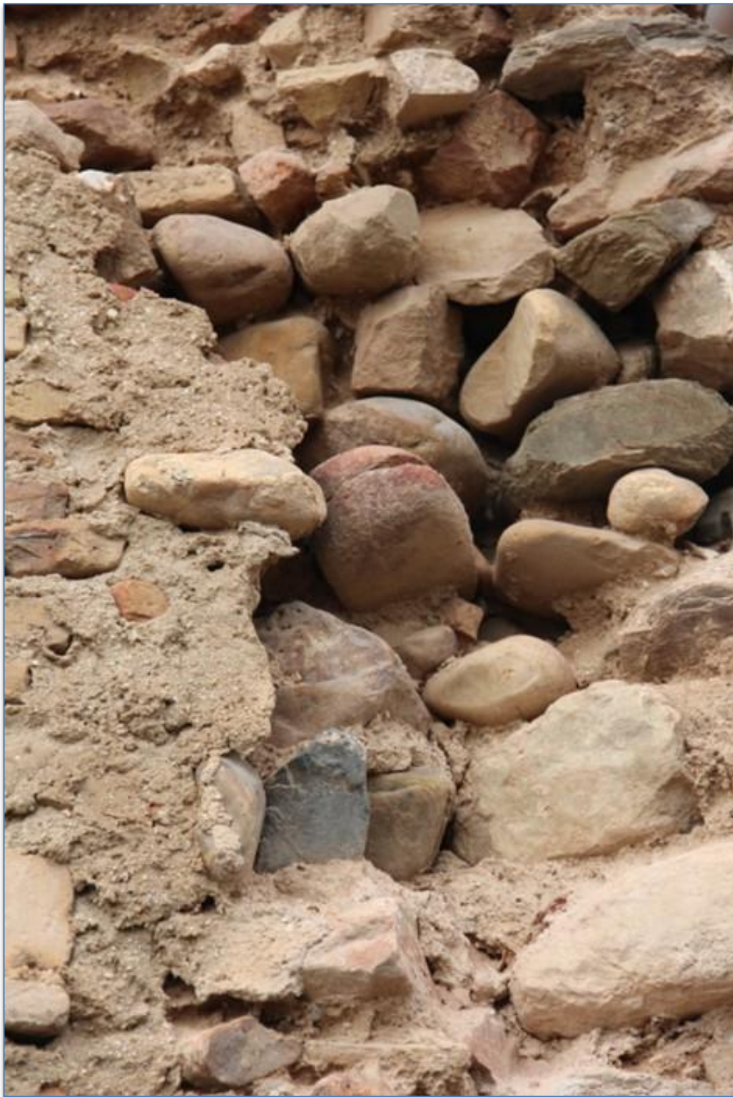
Detalle materiales sueltos alzado este