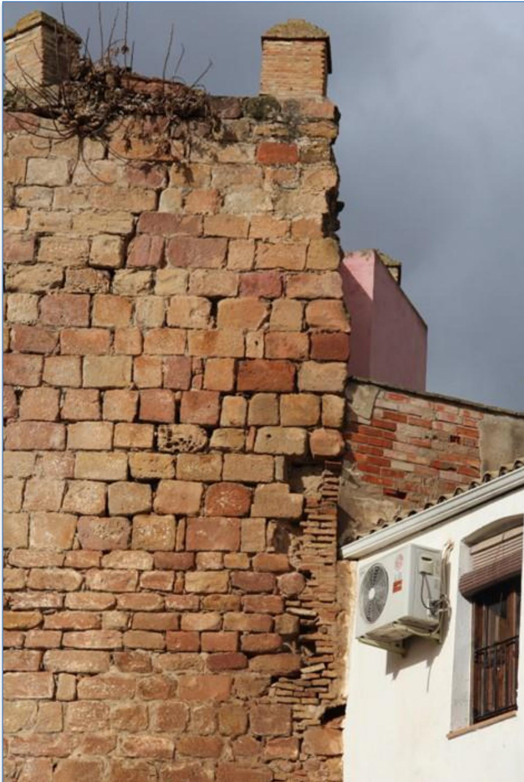
Detalle reconstrucción perdida de sección alzado este