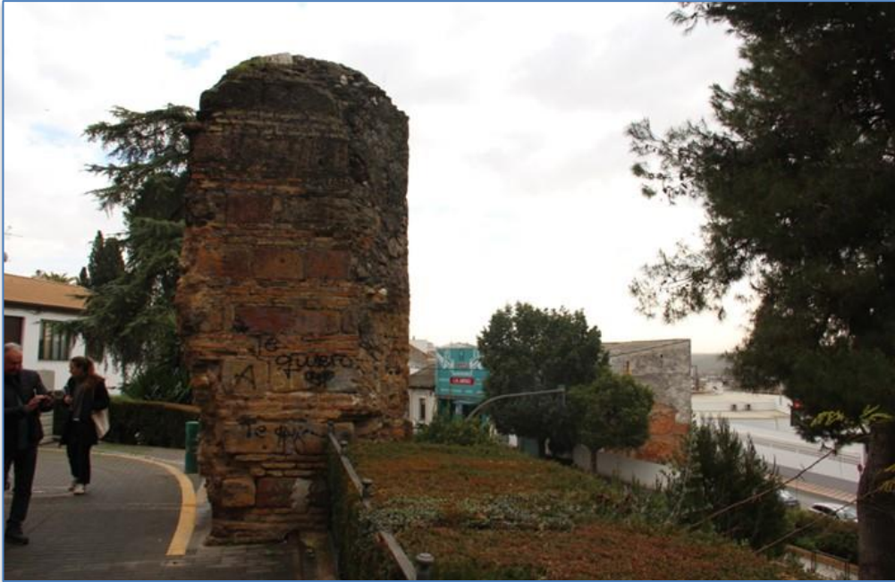
Perspectiva alzado oeste – zona ajardinada