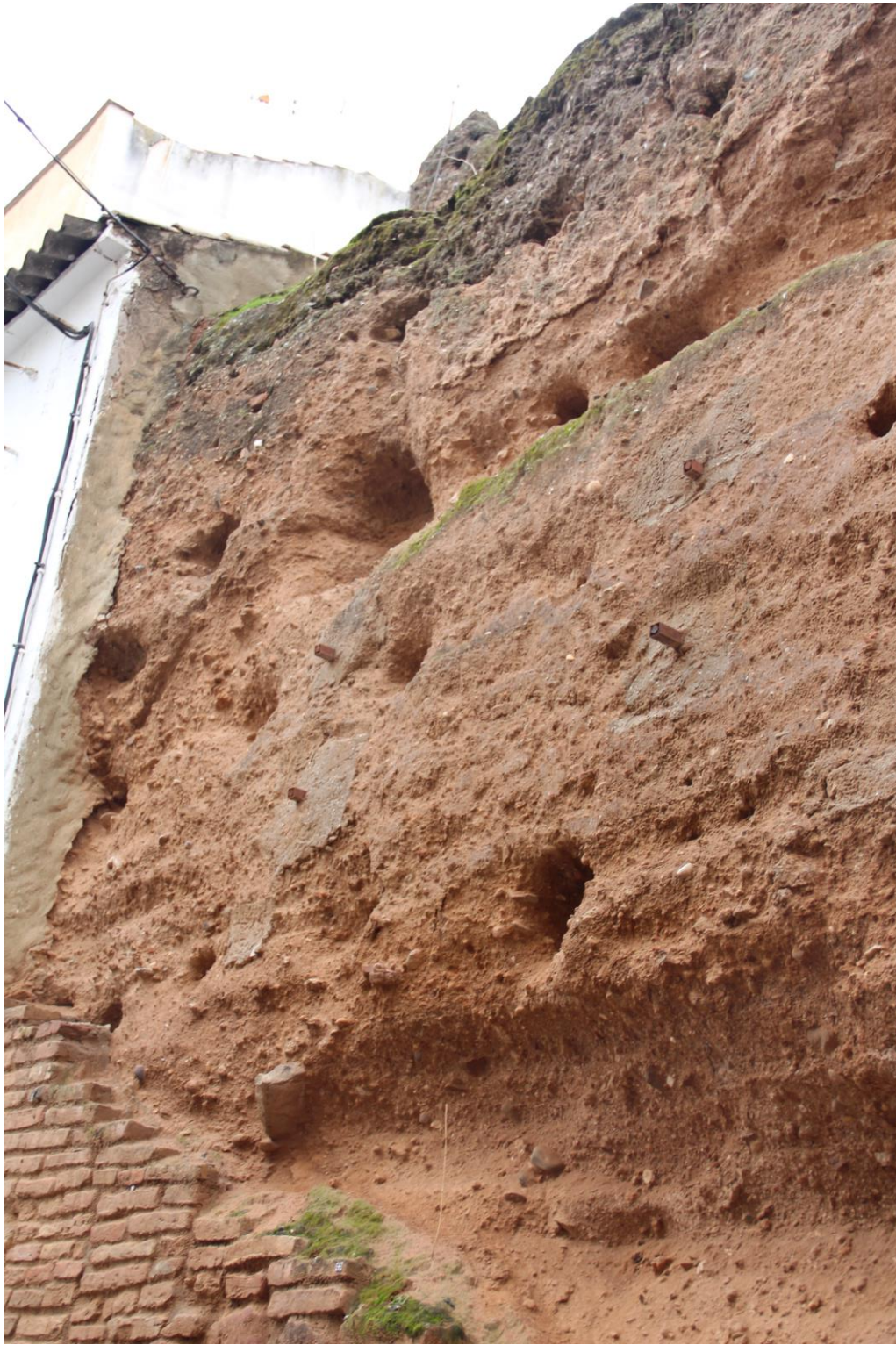
Detalle mechinales alzado oeste