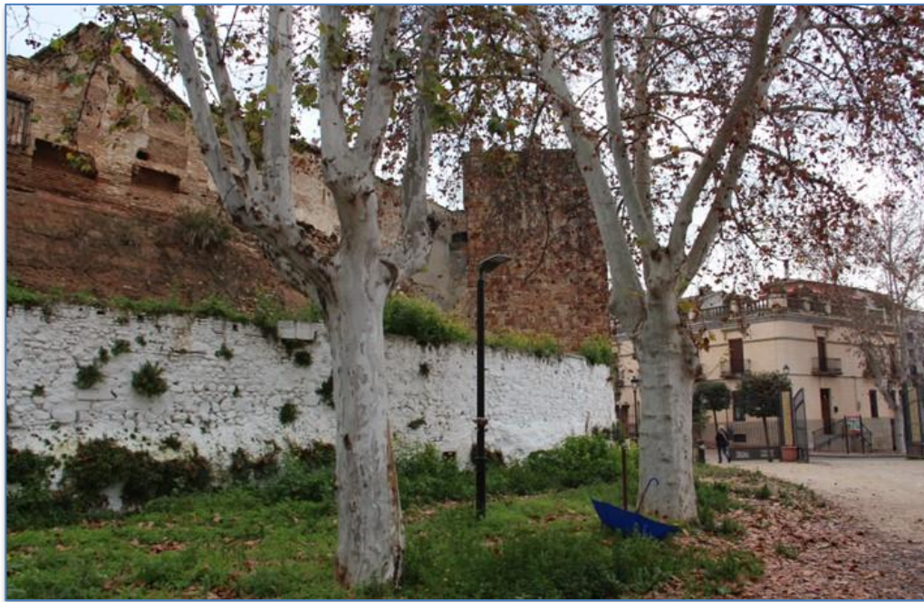
Entorno Torre de la Fuente Sorda alzado oeste