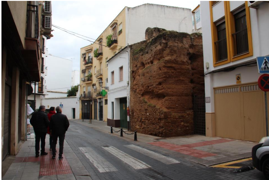
Entorno Torre del Hoyo