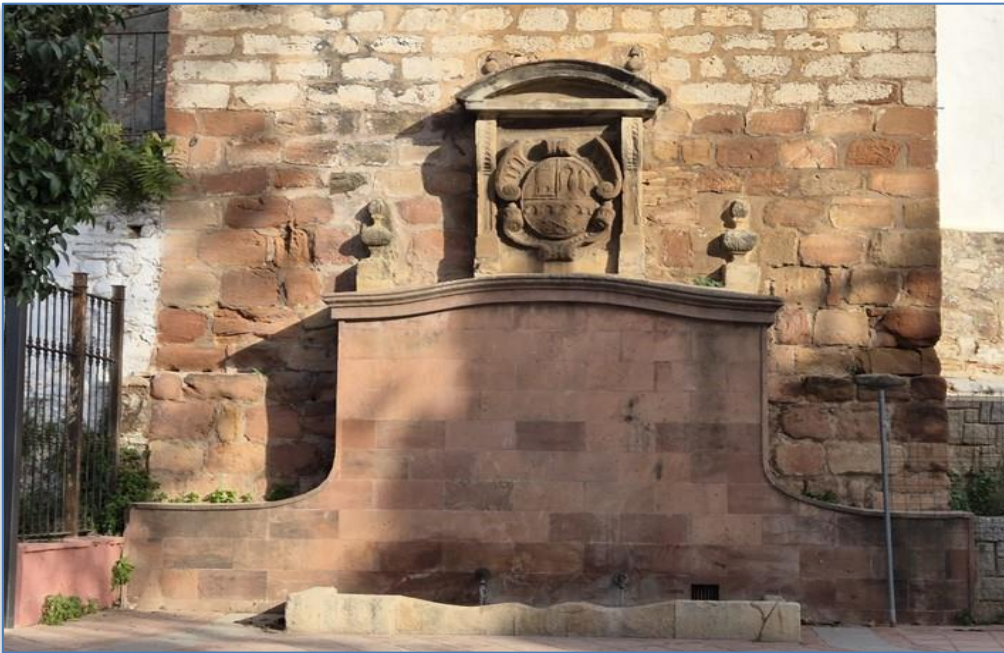
Detalle fuente alzado sur