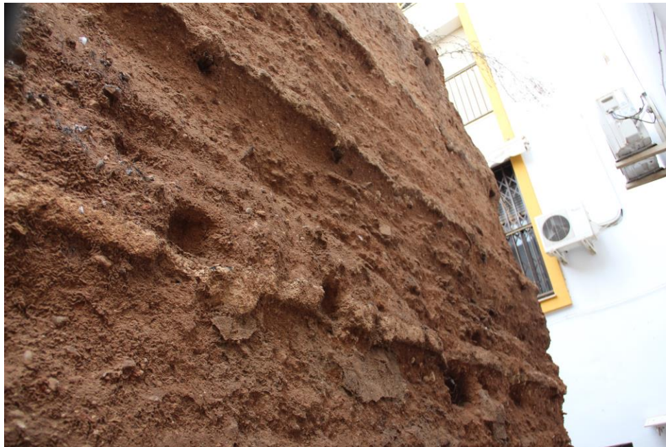
Detalle calicostra alzado sur