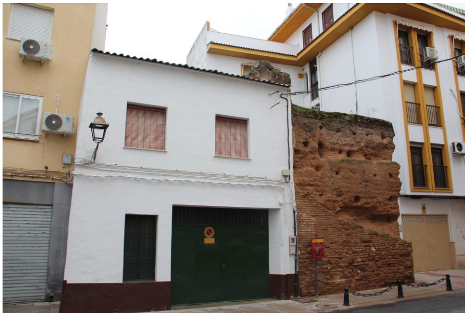
Entorno torre del Hoyo