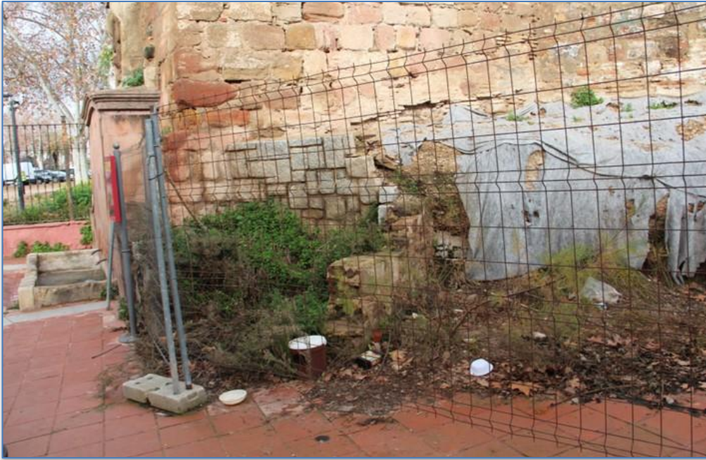
Detalle cimentación alzado este