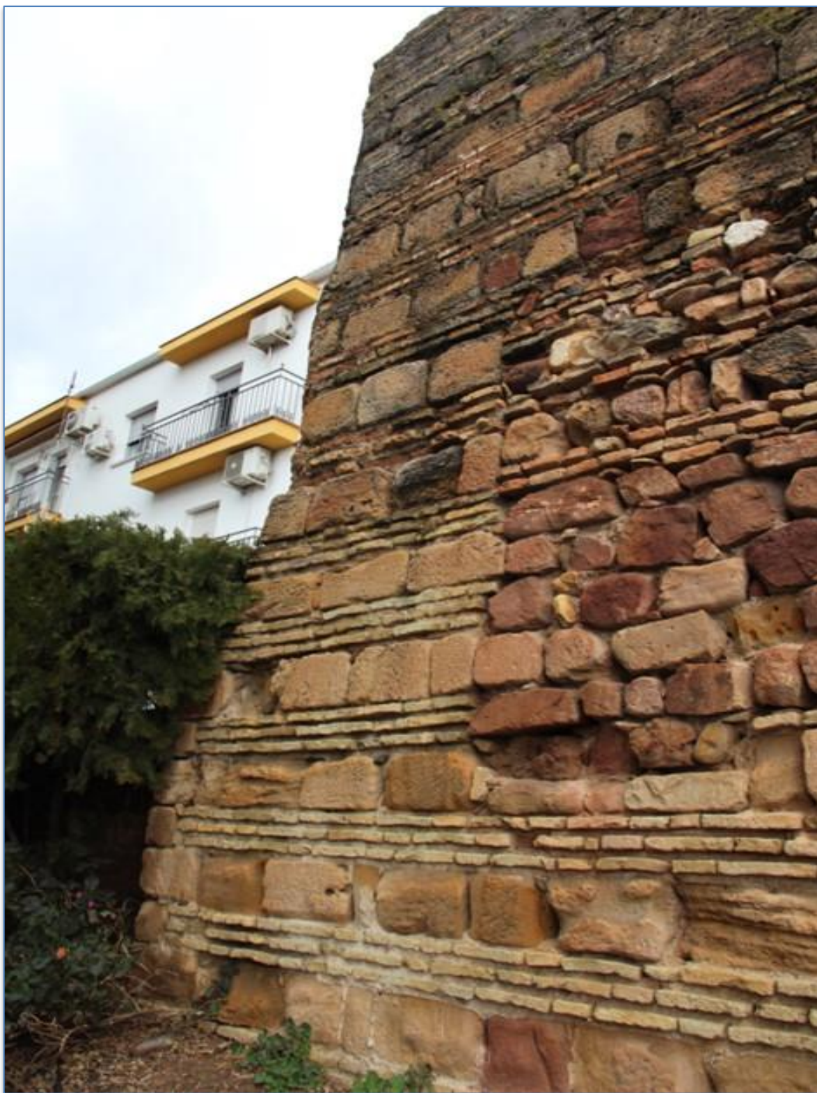
Detalle reconstrucción cimentación alzado sur