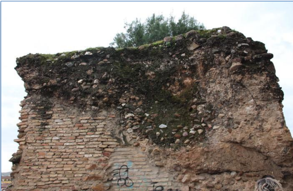
Detalle patologías organismos biológicos