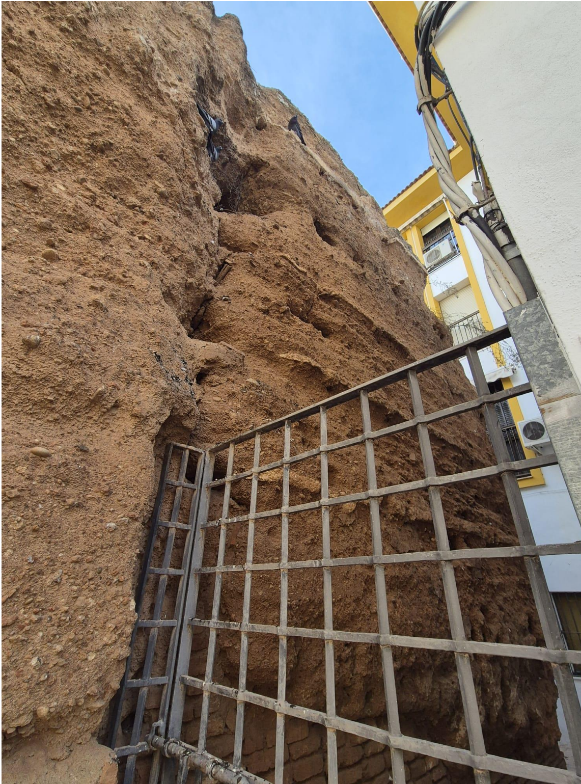
Detalle puerta acceso