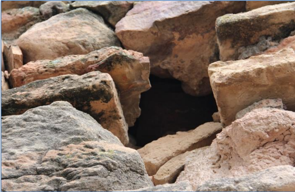
Detalle hueco en lienzo alzado sur