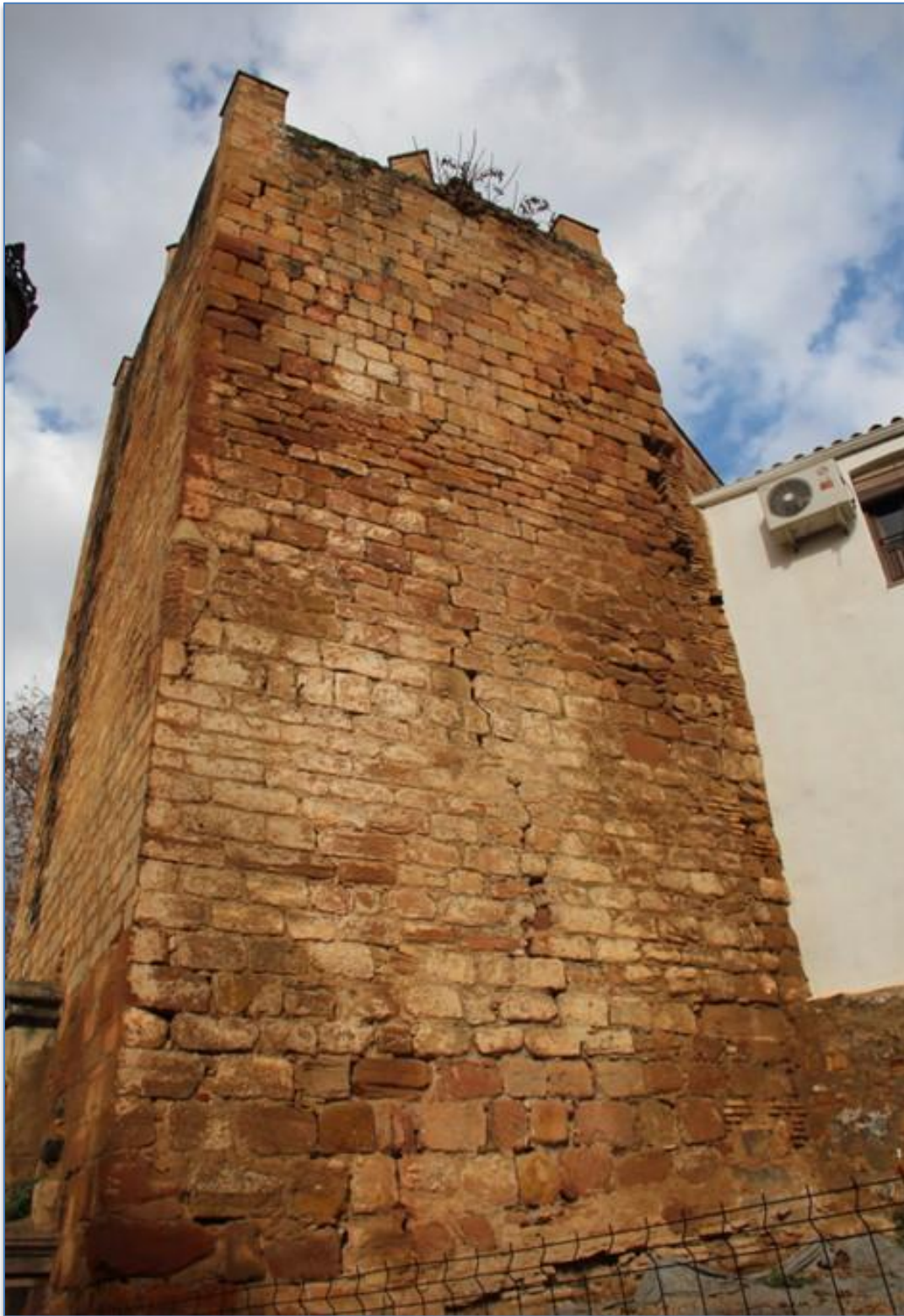
Detalle alzado este patologías