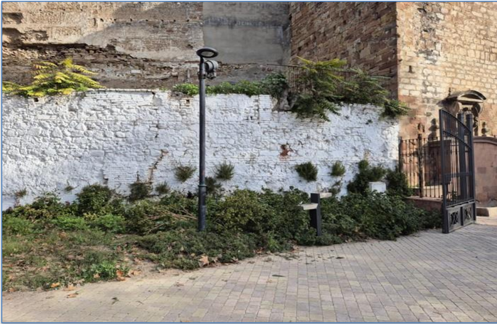
Detalle entorno alzado oeste