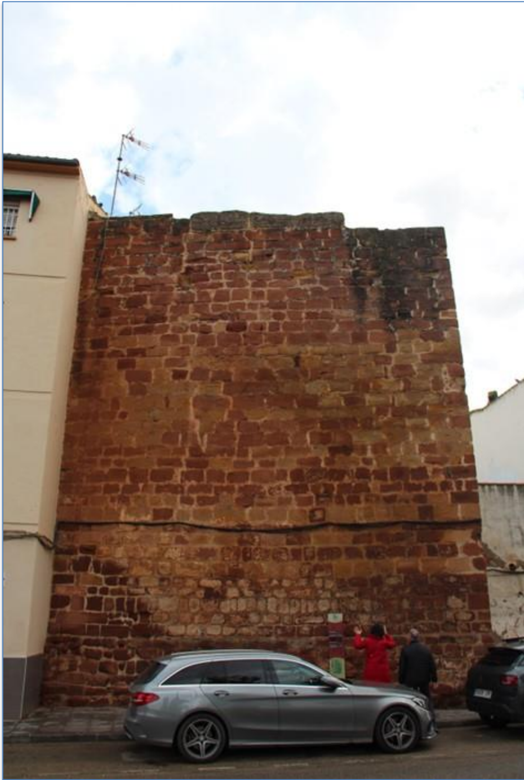
Detalle de instalaciones en alzado oeste