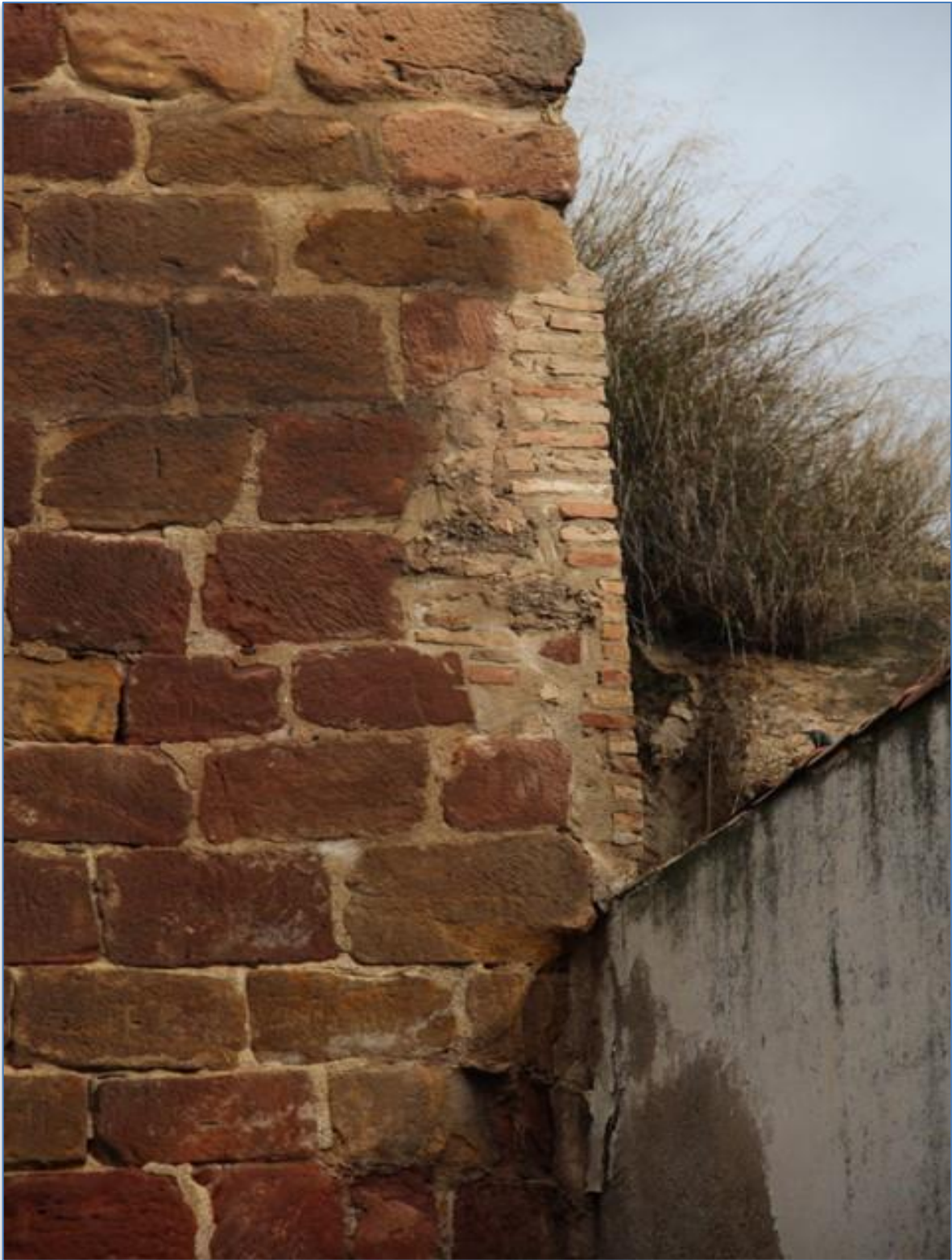
Detalle reconstrucción con materiales contemporáneos