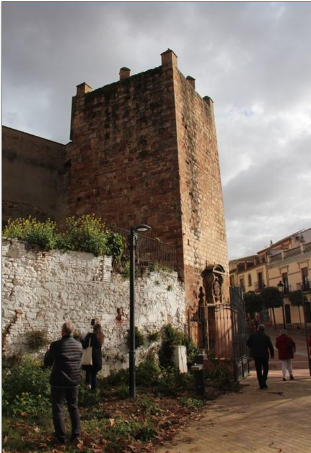
Alzado oeste - sur