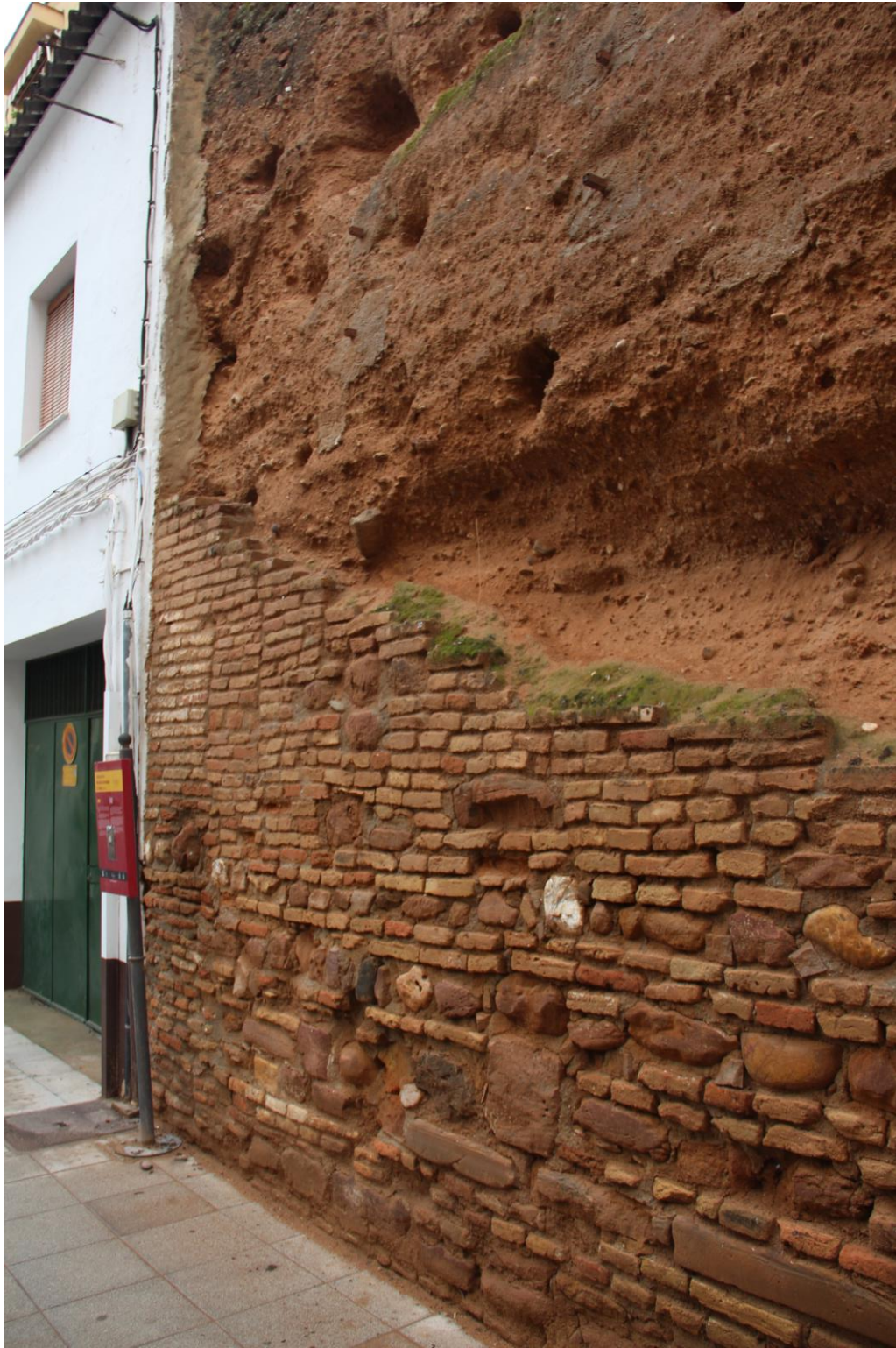
Detalle socalce alzado oeste