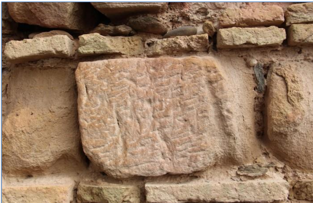
Detalle mampuesto alzado sur