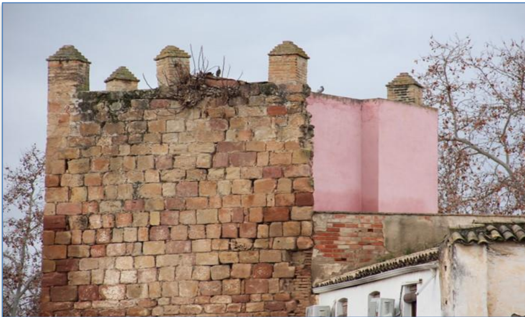
Detalle alzado este – norte