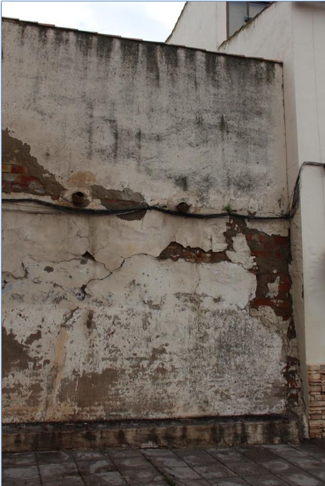
Detalle de instalaciones en alzado muro oeste