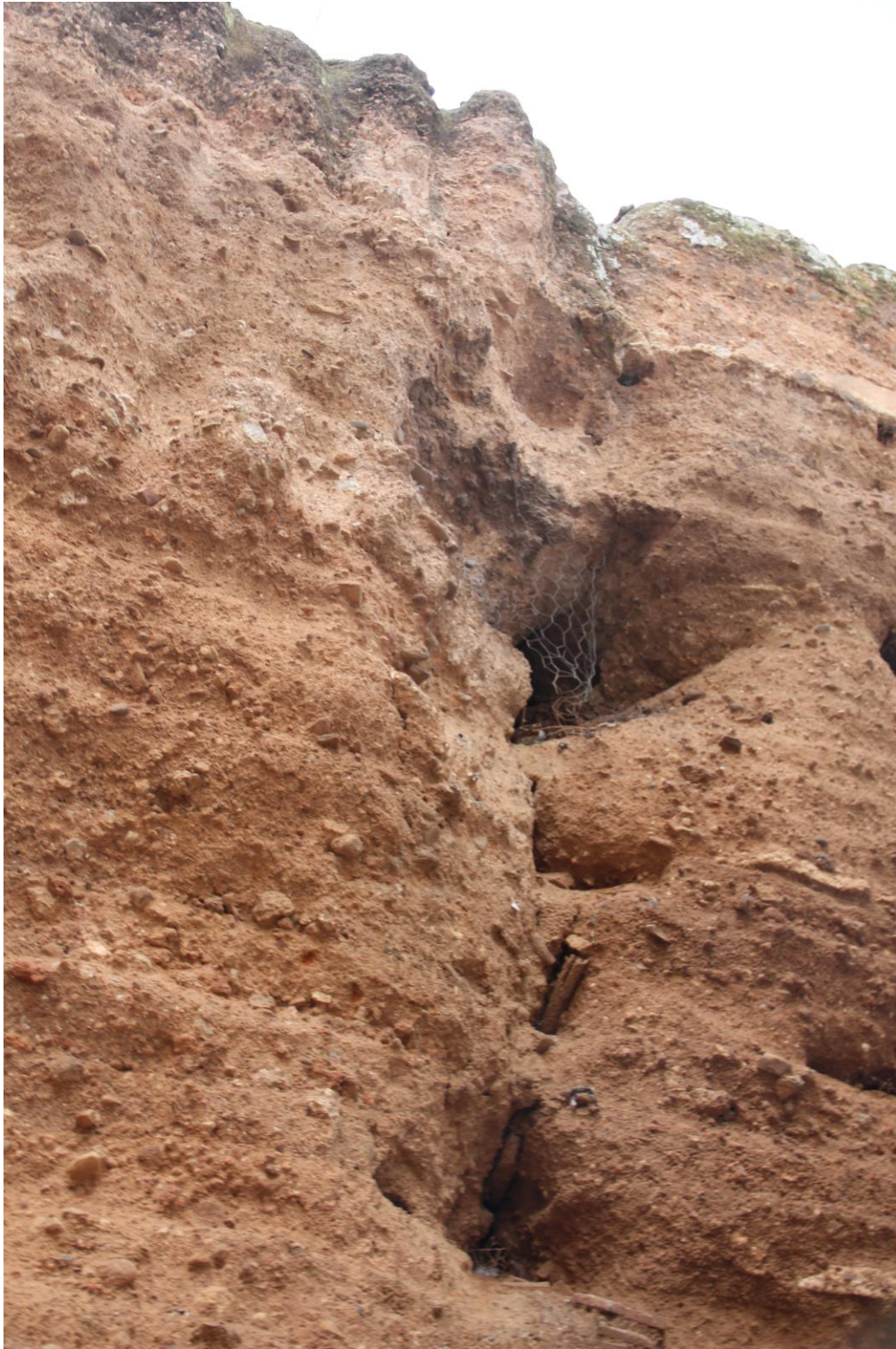
Detalle mechinales alzado sur