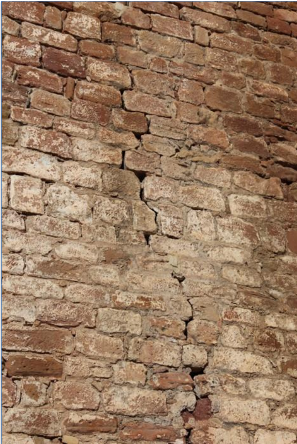
Detalle grieta alzado este