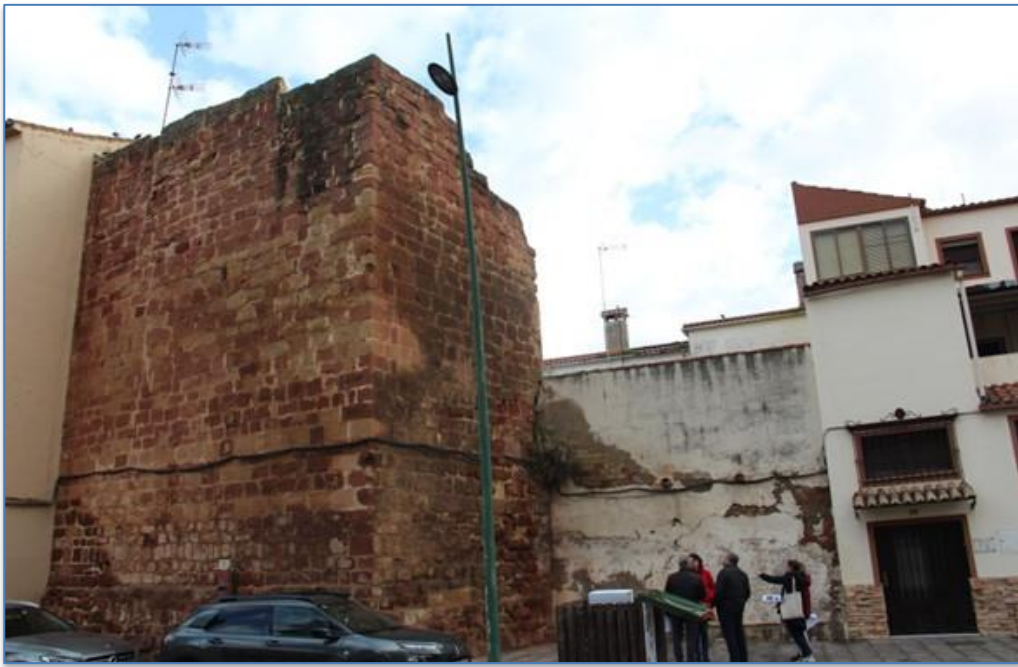
Detalle entorno Torre de Tavira