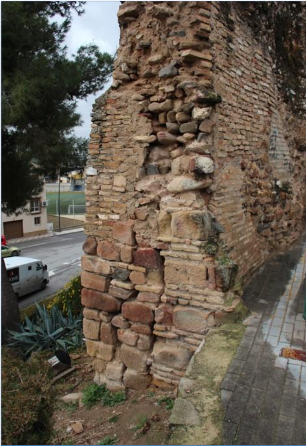
Detalle cimentación alzado este