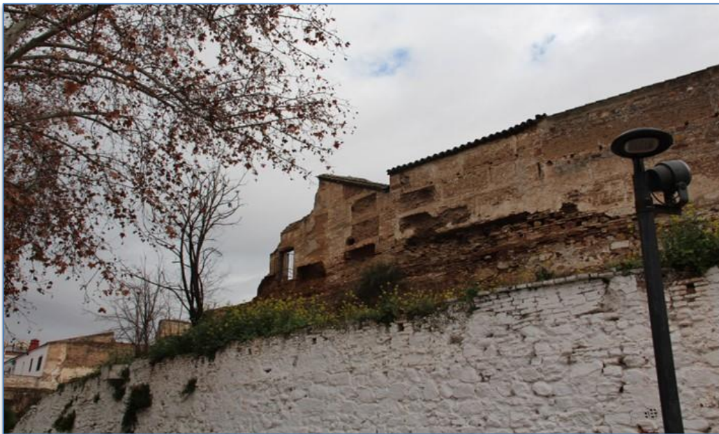
Entorno Torre de la Fuente Sorda alzado oeste