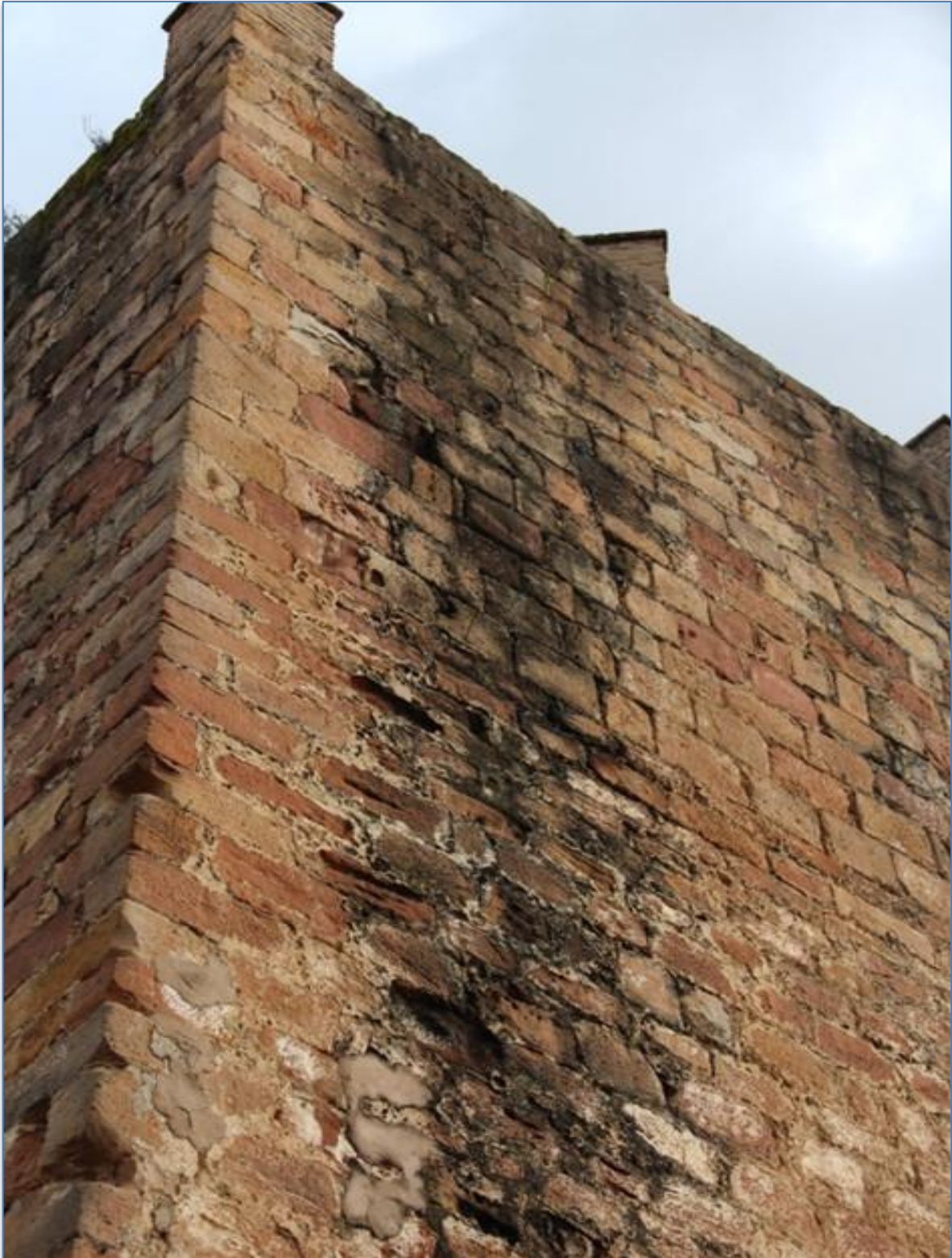
Detalle humedades alzado sur