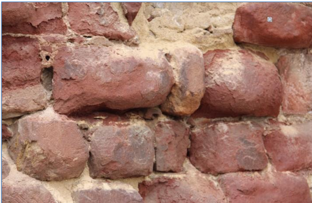
Detalle patologías en alzado sur