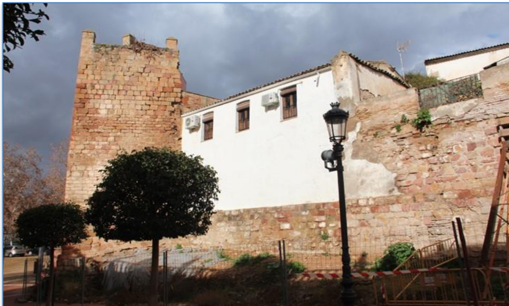
Entorno Torre de la Fuente Sorda alzado este