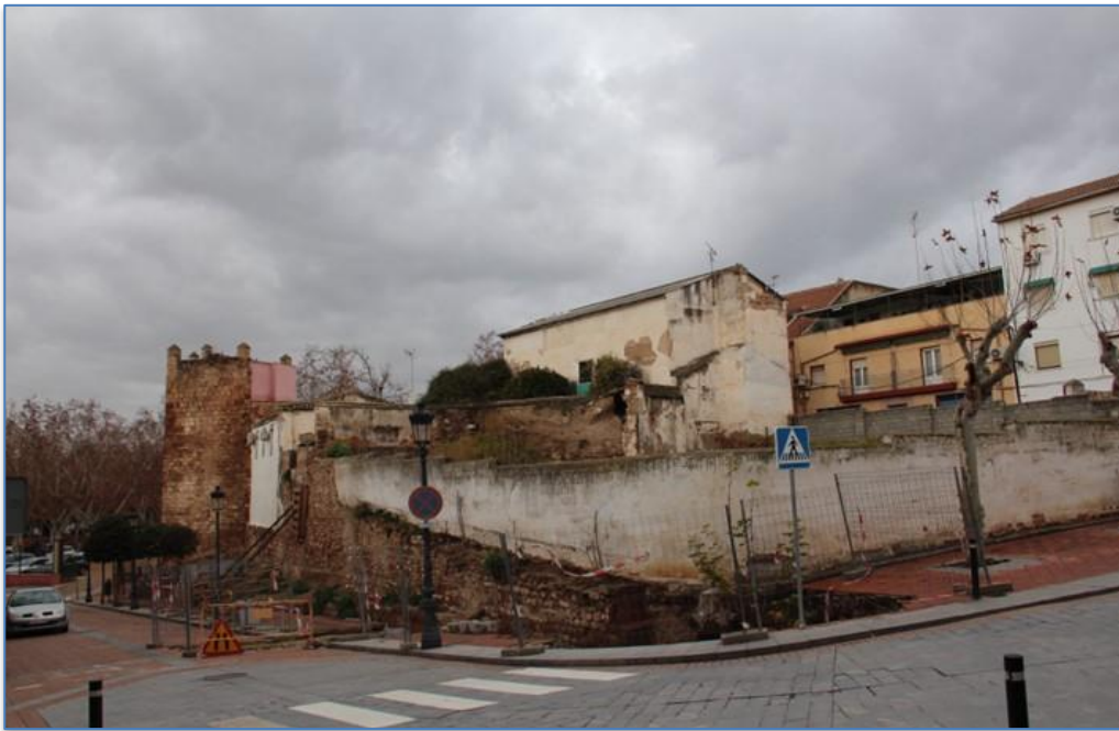
Entorno Torre de la Fuente Sorda alzado este