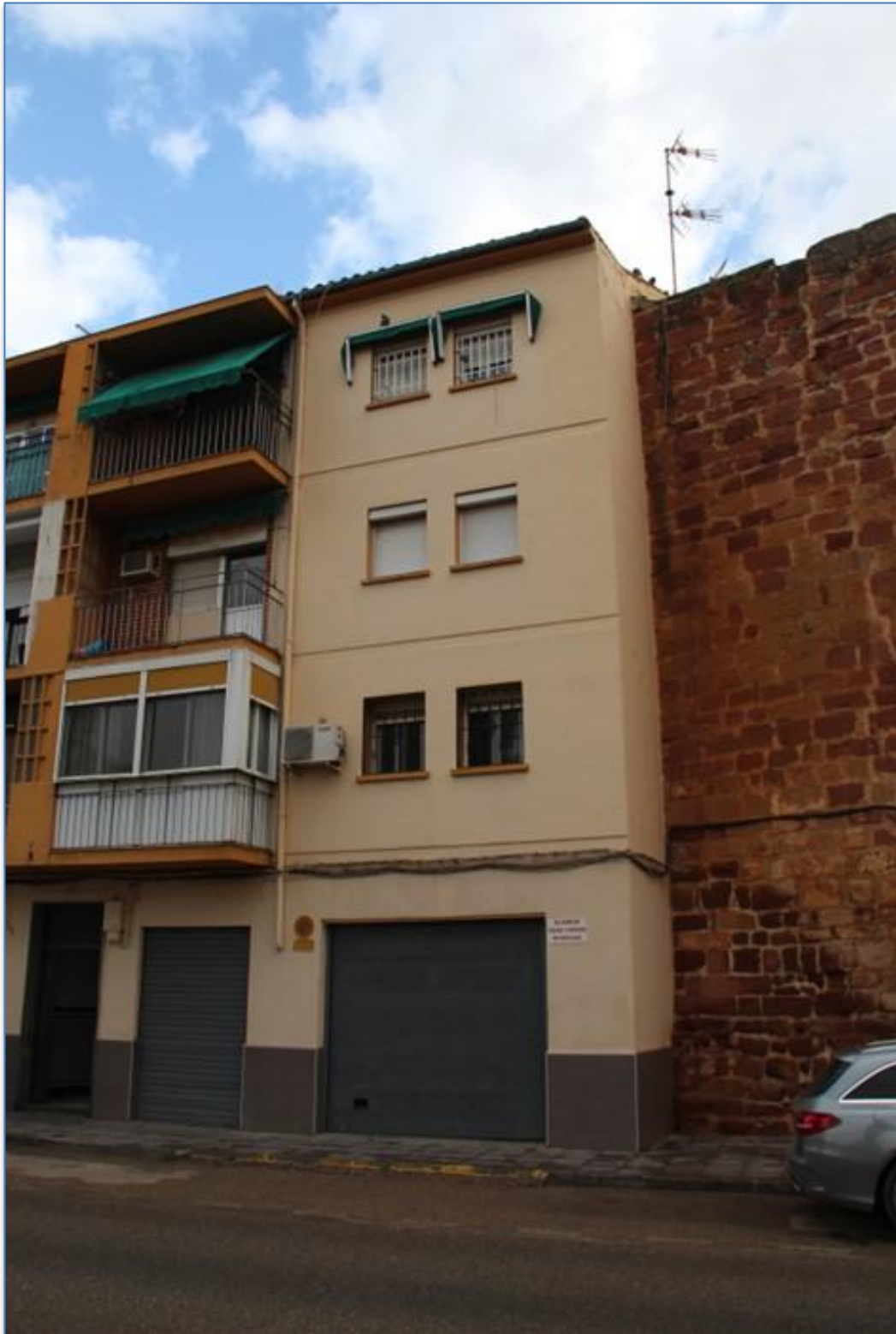
Detalle entorno alzado oeste

Proyecto de Conservación de 4 Torreones del Conjunto Amurallado de Andújar