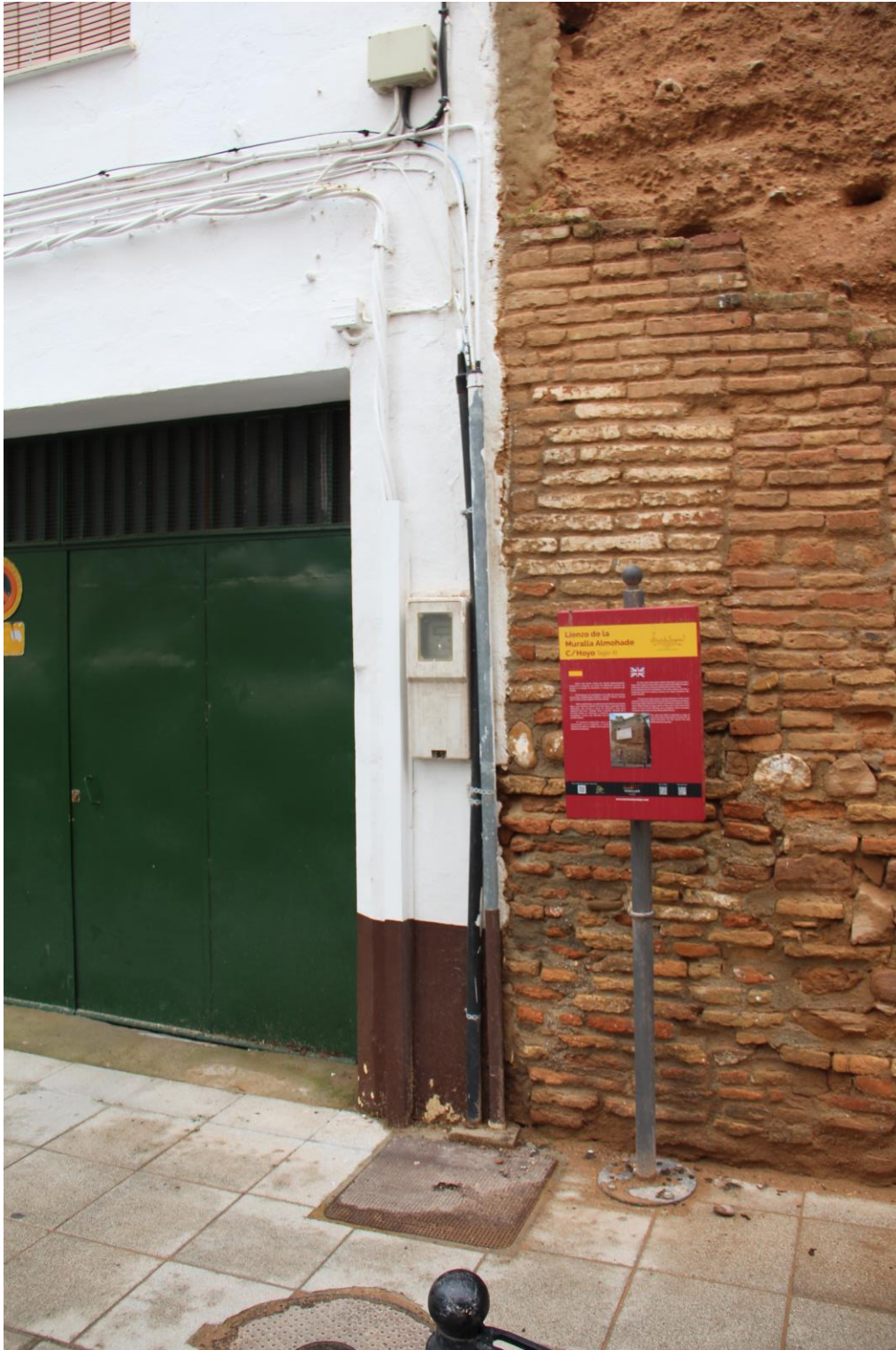
Detalle soterramiento instalaciones

Proyecto de Conservación de 4 Torreones del Conjunto Amurallado de Andújar