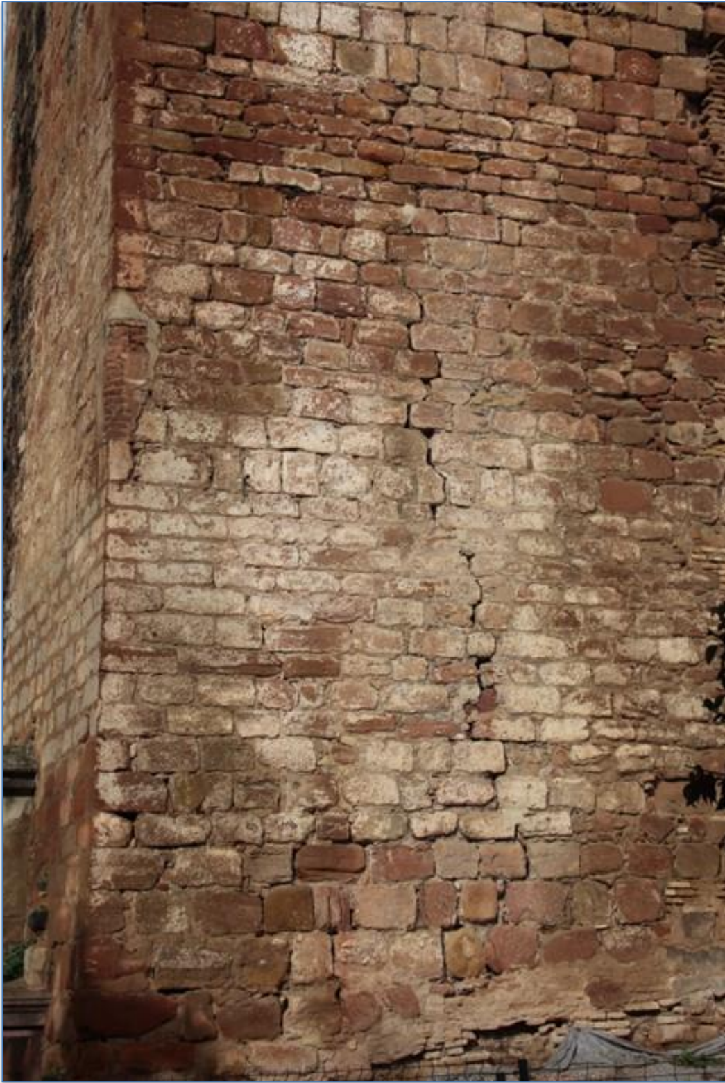
Detalle grieta alzado este