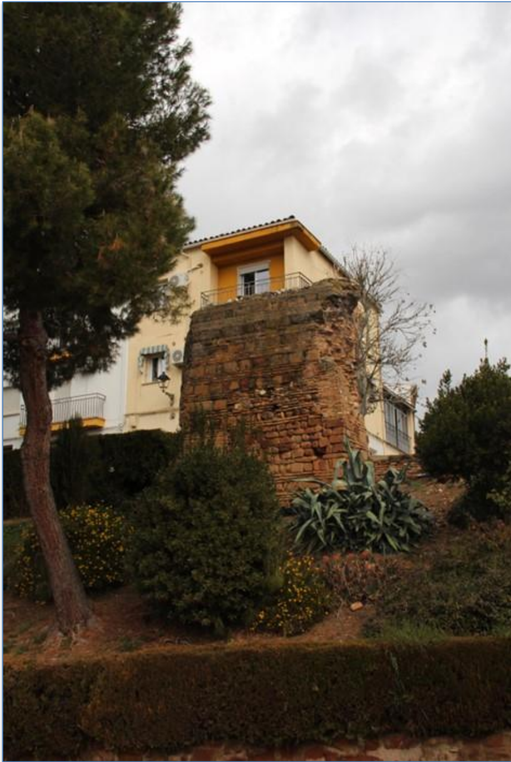
Alzado sur y zona ajardinada

Proyecto de Conservación de 4 Torreones del Conjunto Amurallado de Andújar