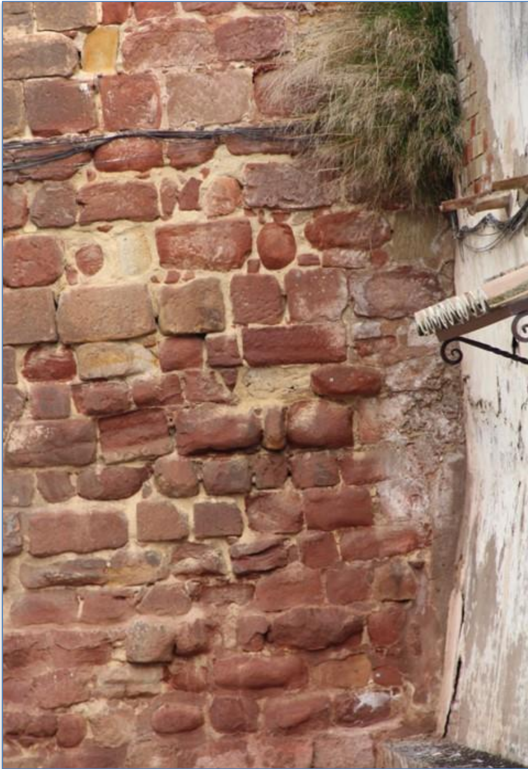
Detalle patologías humedades alzado sur