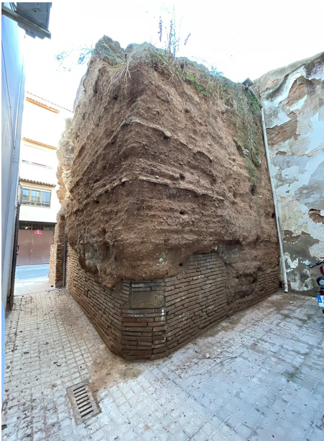
Alzados sur - este