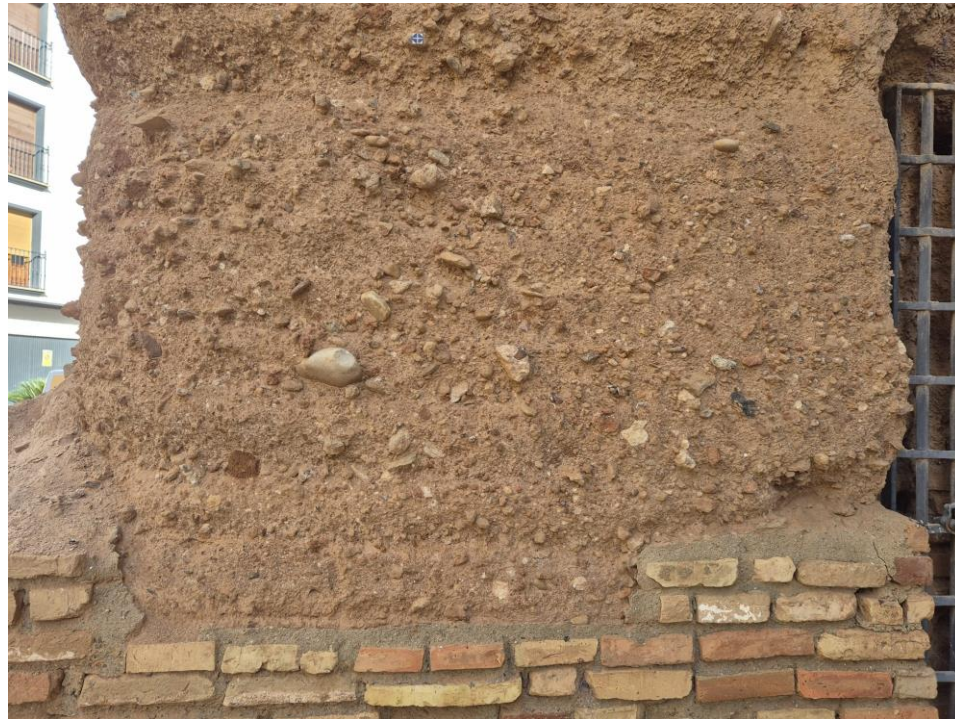
Detalle tapial alzado sur