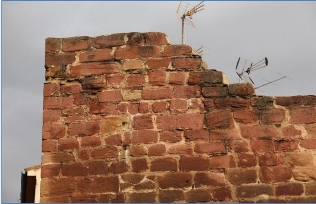
Detalle coronación de Torre alzado sur