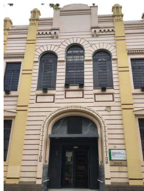
Situación del edificio y fachada principal