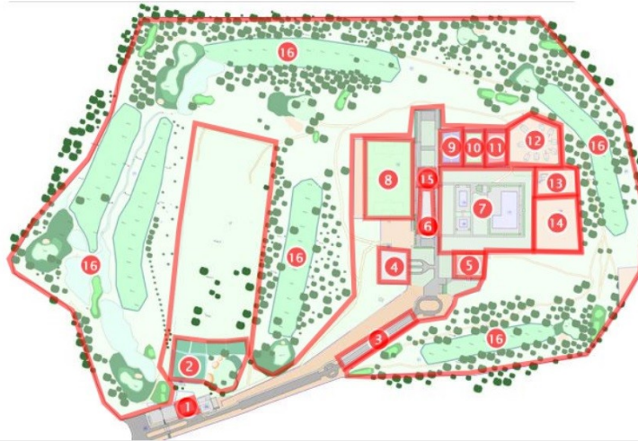
Distribución de espacios de la instalación deportiva

Actualmente, en el campo de fútbol exterior se desarrollan gran cantidad de los entrenamientos y competiciones de fútbol 11 y fútbol 7 que se celebran en estas instalaciones. La iluminación de dicho campo de juego se realiza mediante una serie de luminarias uniformemente repartidas por el perímetro del campo, que por el paso del tiempo y las horas de uso, han superado su vida útil y no se alcanzan los lúmenes necesarios en pista, por lo que esta deficiencia genera una iluminación insuficiente para la correcta práctica deportiva de los usuarios. Además de una obsolescencia de materiales y tecnología empleada, el consumo de dicha instalación es excesivo, para los estándares actuales.