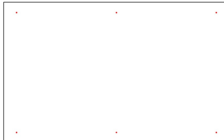
Planta de campo y situación de postes de iluminación

Lámpara: 1 x BENITO NOVATILU (7070) (Factor de corrección 1.000)