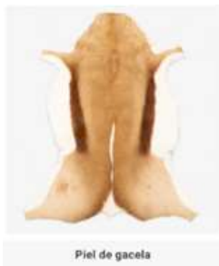
Piel de gacela