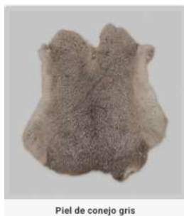
Piel de conejo gris

Importe estimado total (sin IVA): 329,47 €