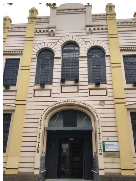
Situación del edificio y fachada principal