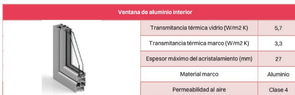
Características de las ventanas interiores propuestas

Las características mínimas que deben contemplar las ventanas, sin perjuicio de que puedan incorporarse soluciones que mejoren dichas prestaciones, siempre que se mantenga la compatibilidad con el diseño general y los objetivos de eficiencia energética del proyecto, son las siguientes: