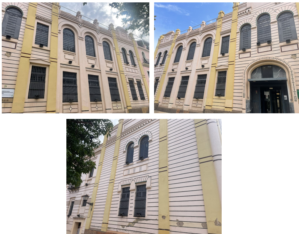
Imágenes de las ventanas sobre las que actuar