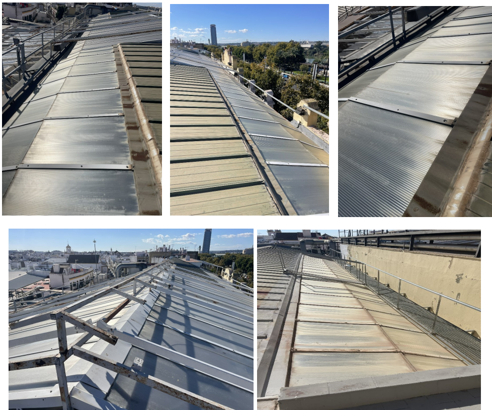
Imágenes de los paneles a sustituir

Ahorro obtenido de la MAE sustitución de los lucernarios