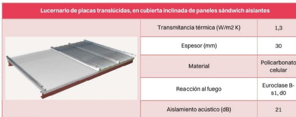
Características de los lucernarios propuestos en Auditoría Energética

En el caso de los lucernarios de cubierta se propone la sustitución de todas las láminas de material plástico que los componen por otras de policarbonato alveolar, que tiene unas prestaciones térmicas mucho mejor. La sustitución propuesta es lucernario por lucernario y no conllevan más dificultades técnicas de las propias de la ejecución de las obras. Con esta sustitución se mejorará también las uniones de los lucernarios con la cubierta de chapa evitándose así gran parte del problema de filtraciones desde la cubierta que actualmente sufre el edificio. Las características mínimas que deben contemplar los lucernarios, sin perjuicio de que puedan incorporarse soluciones que mejoren dichas prestaciones, siempre que se mantenga la compatibilidad con el diseño general y los objetivos de eficiencia energética del proyecto, son las siguientes: