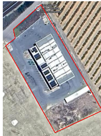
Imagen 2.2. ITV Écija