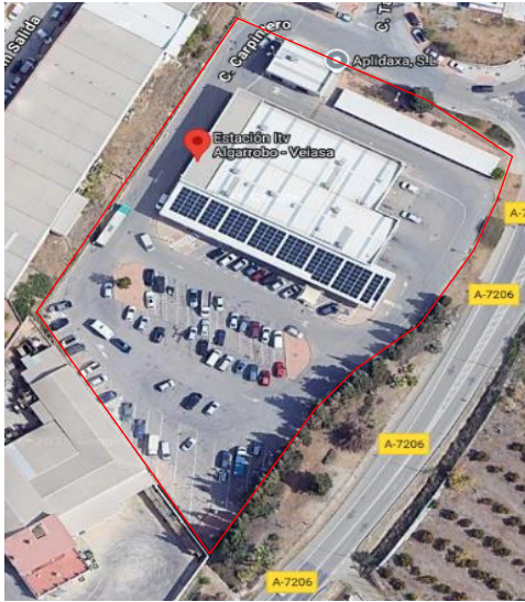
Imagen 1.1. ITV Algarrobo