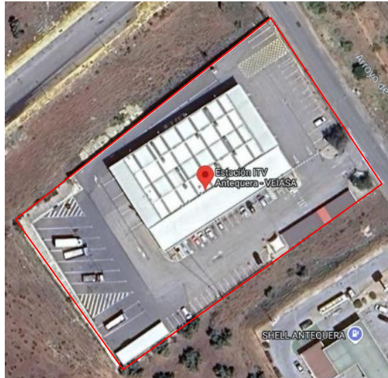
Imagen 1.2. ITV Antequera