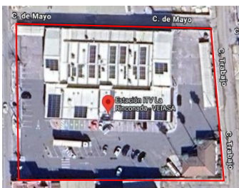
Imagen 2.5. ITV La Rinconada