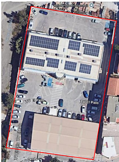
Imagen 1.3. ITV El Palo