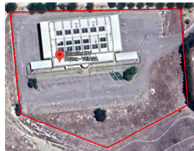
Imagen 2.4. ITV Osuna