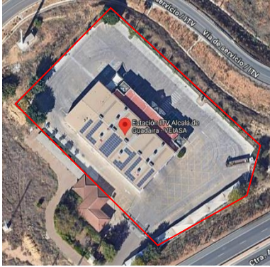
Imagen 2.1. ITV Alcalá de Guadaíra