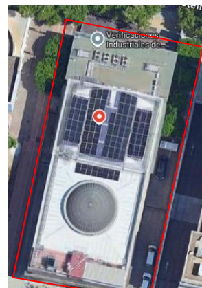
Imagen 2.6. Central