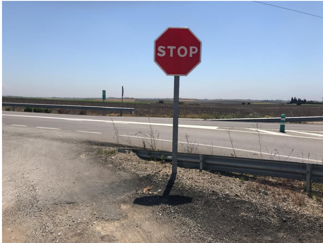
Imagen nº5. Acceso a glorieta desde camino sin asfaltar paralelo a la A-91