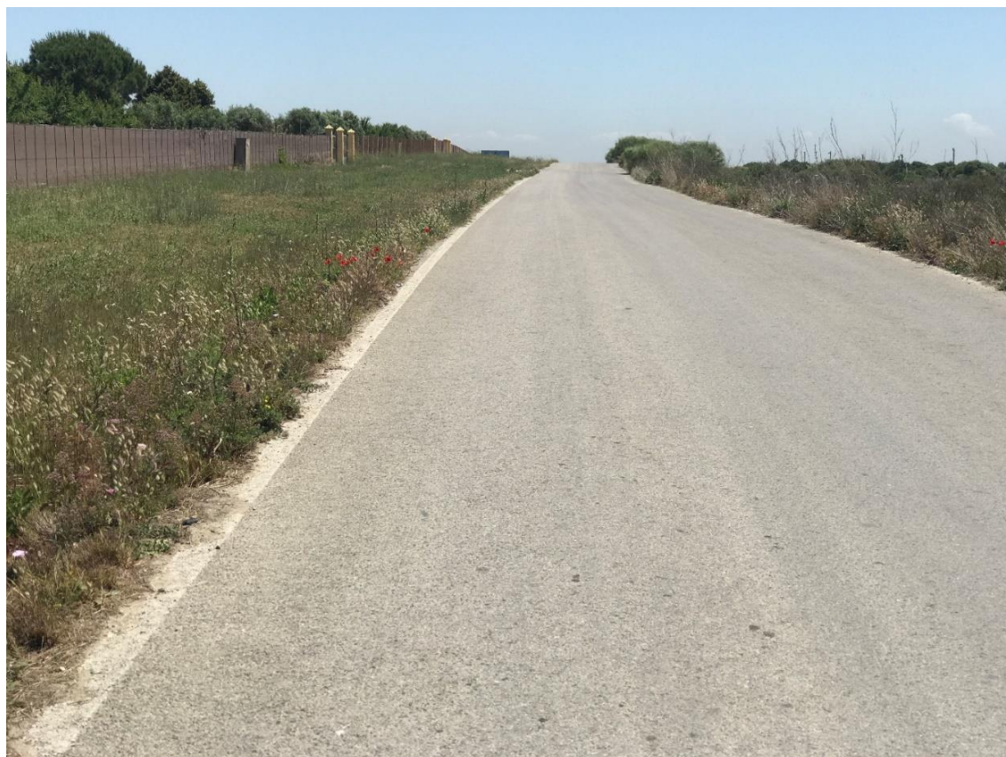
Imagen nº14. Vía de servicio paralela a la A-491