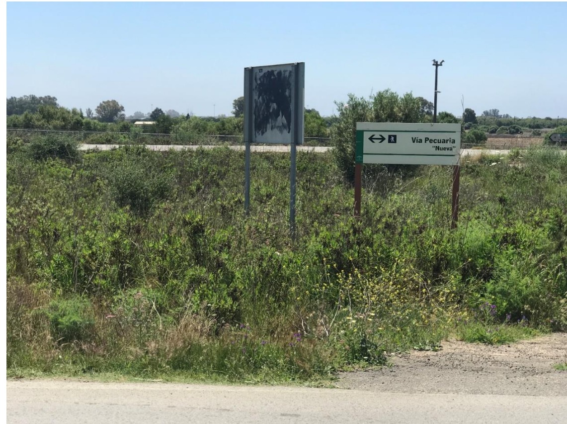
Imagen nº11. Señalización de vía Pecuaria