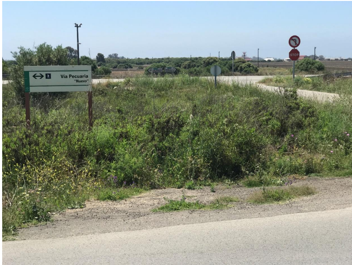
Imagen nº13. Señalización de vía pecuaria