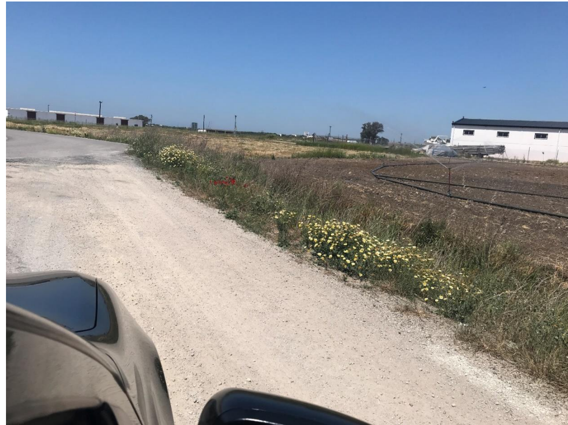
Imagen nº9. Conexión entre camino sin asfaltar con Vía de servicio paralela a la A-491 (Glorieta)