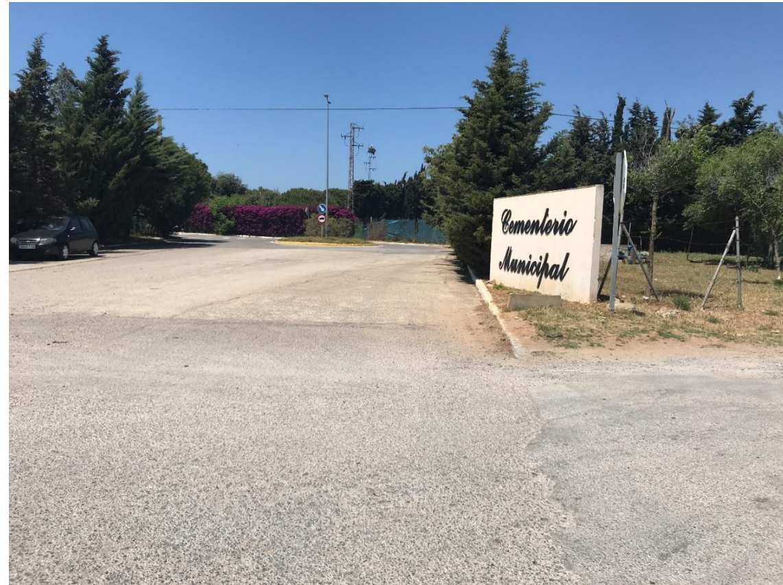
Imagen nº19. Acceso a Cementerio Municipal (Margen derecho)