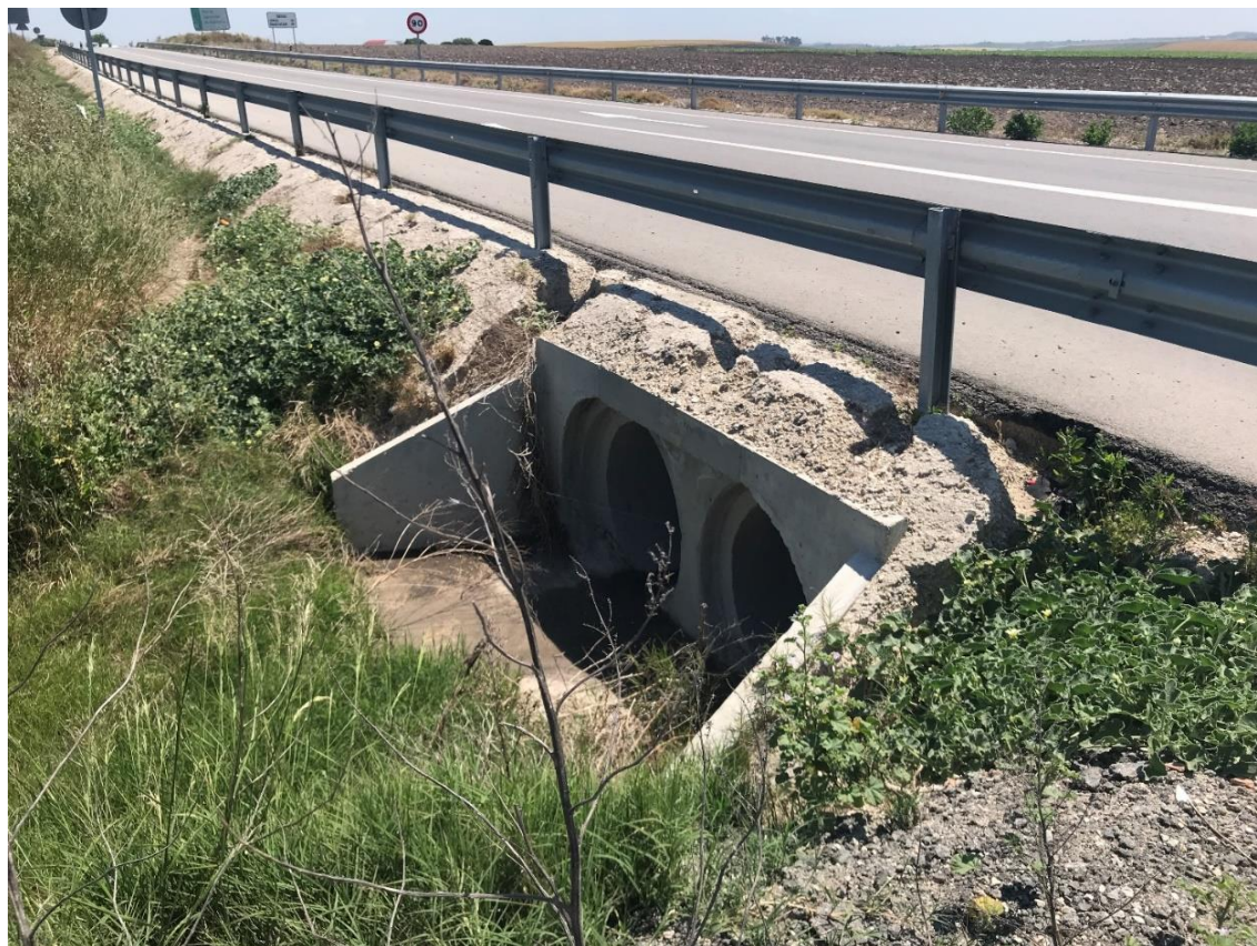
Imagen nº6. Obra de Fabrica en conexión de A-2078 con Glorieta existente