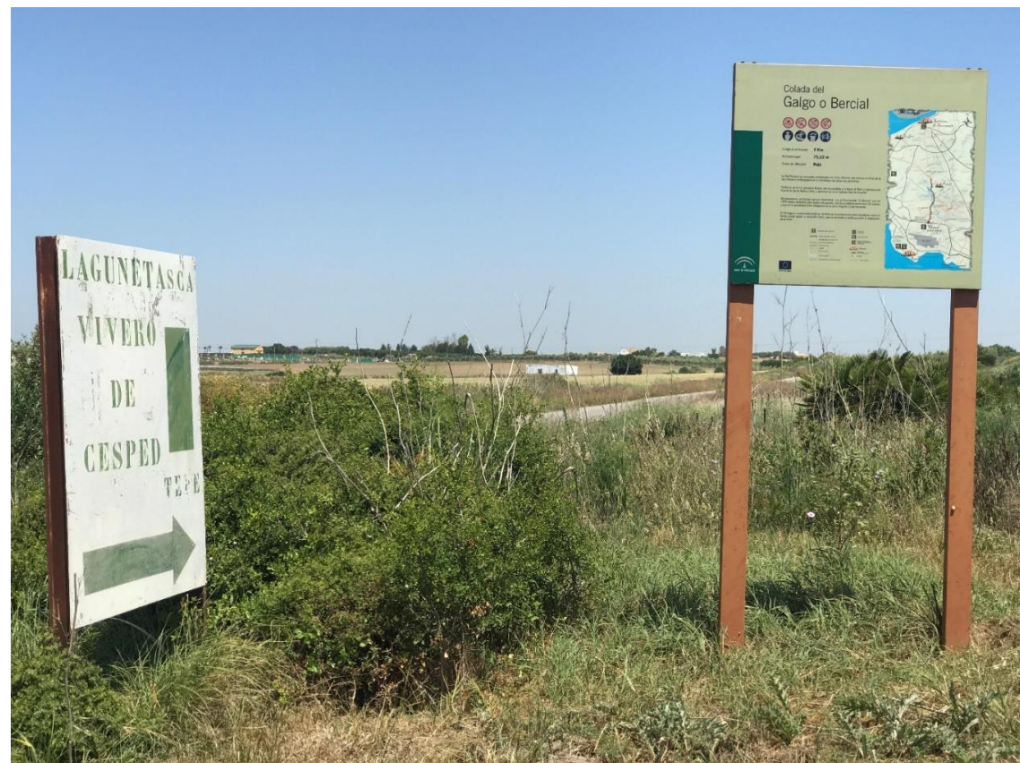
Imagen nº10. Señalización de Vivero y vía pecuaria (Colada del Galgo o Bercial)