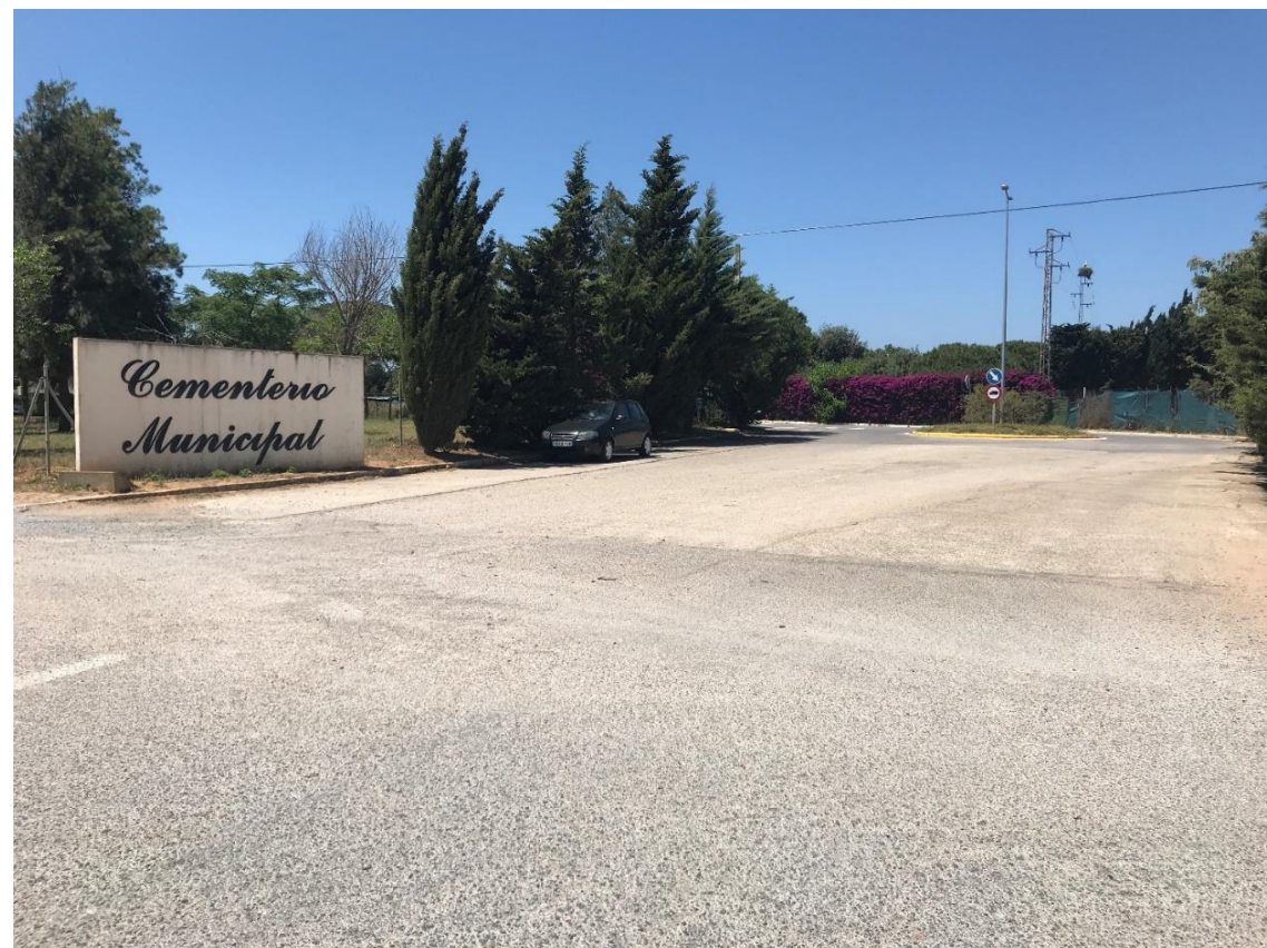
Imagen nº18. Acceso a Cementerio Municipal (Margen izquierdo)