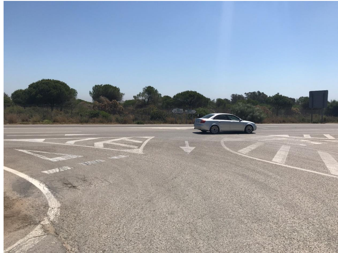
Imagen nº17. Acceso a Cementerio Municipal