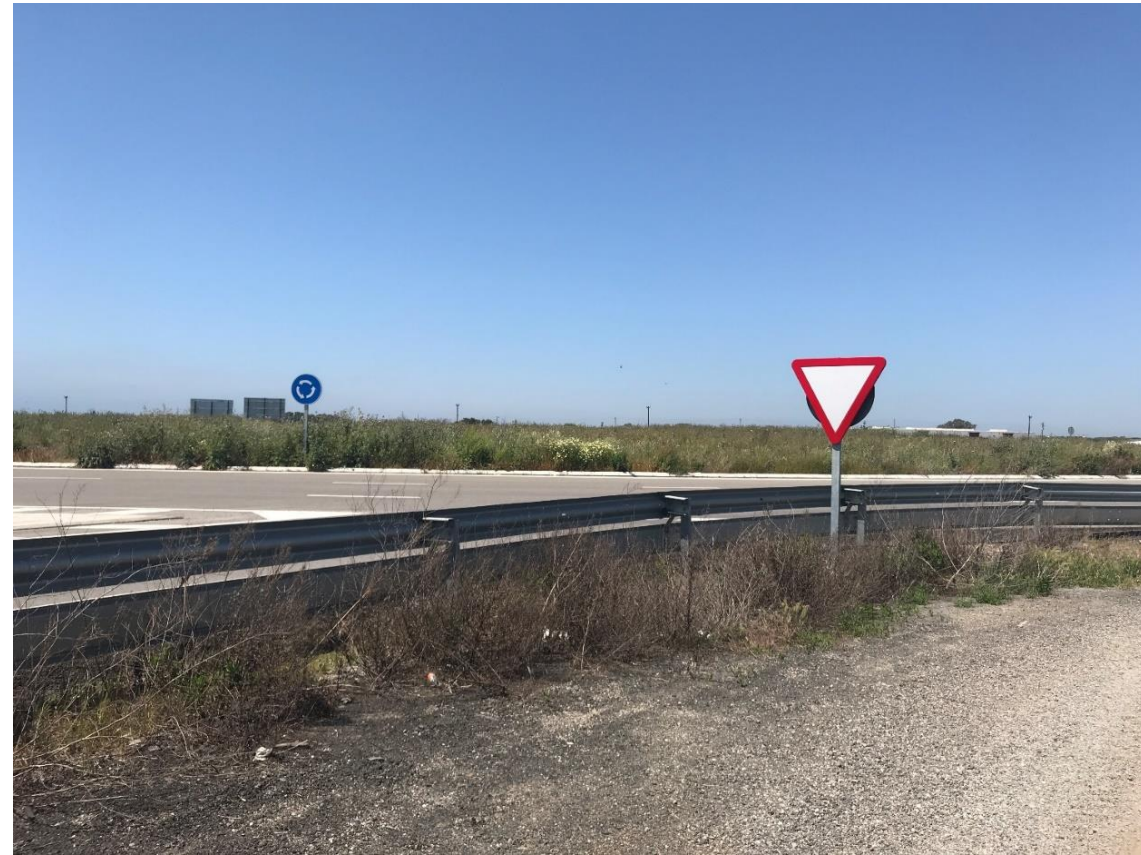
Imagen nº3. Acceso a glorieta desde camino sin asfaltar paralelo a la A-91