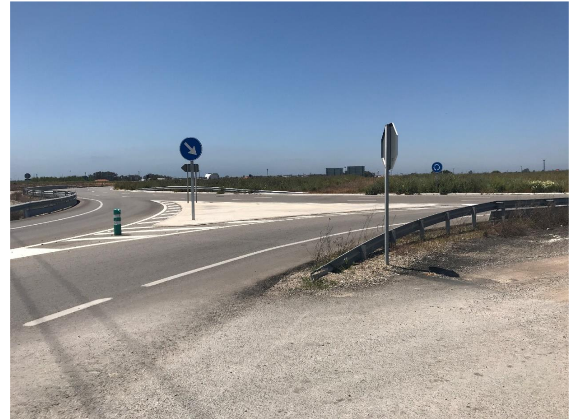
Imagen nº7. Entrada a glorieta desde A-2078