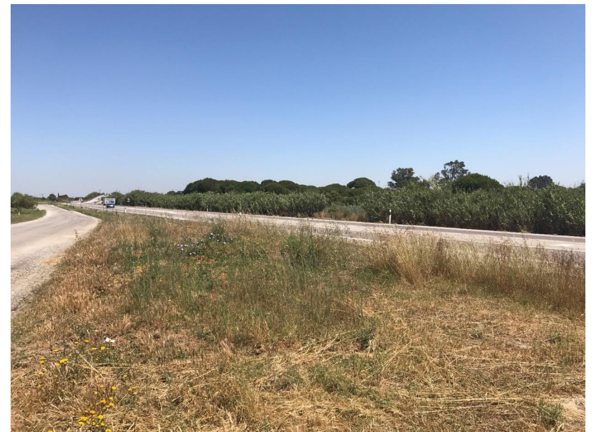
Imagen nº16. Sobrancho terreno en vía de servicio paralela a la A-491