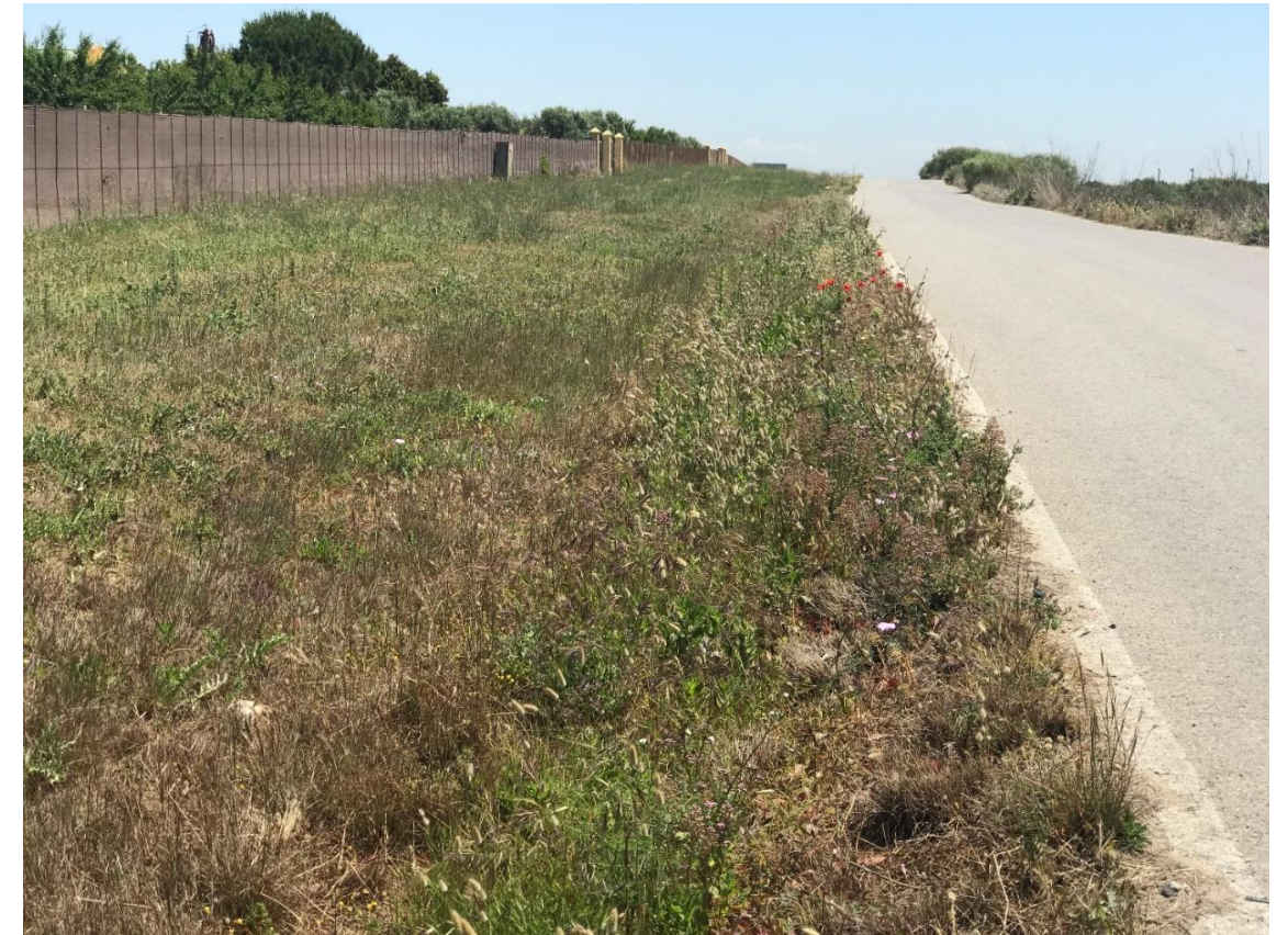
Imagen nº15. Vía de servicio paralela a la A-491