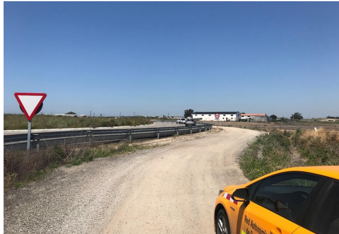
Imagen nº1. Camino sin asfaltar paralelo a la A-91