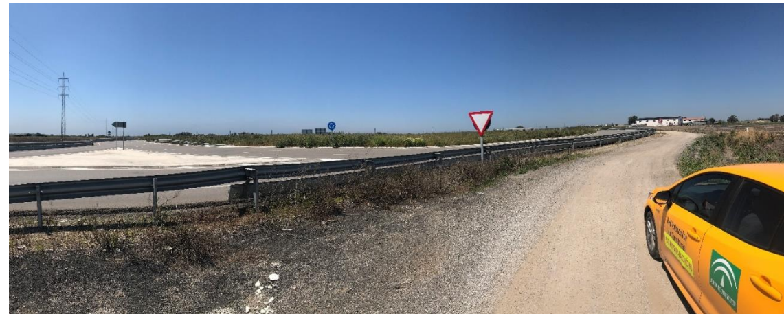
Imagen nº4. Acceso a glorieta desde camino sin asfaltar paralelo a la A-491