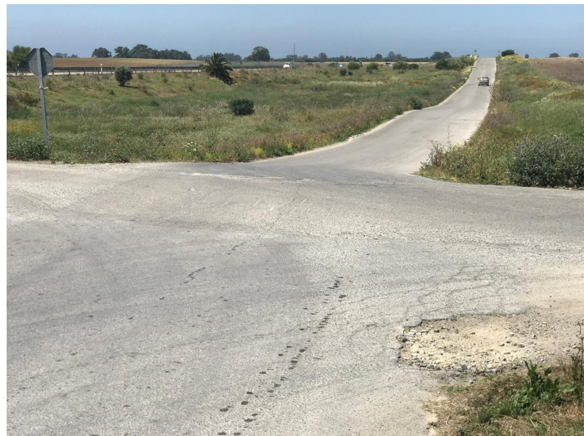
Imagen nº12. Cruce entre Vía de servicio paralela a A-491 y conexión con la A-491 en el PK 12+000 del eje del tronco