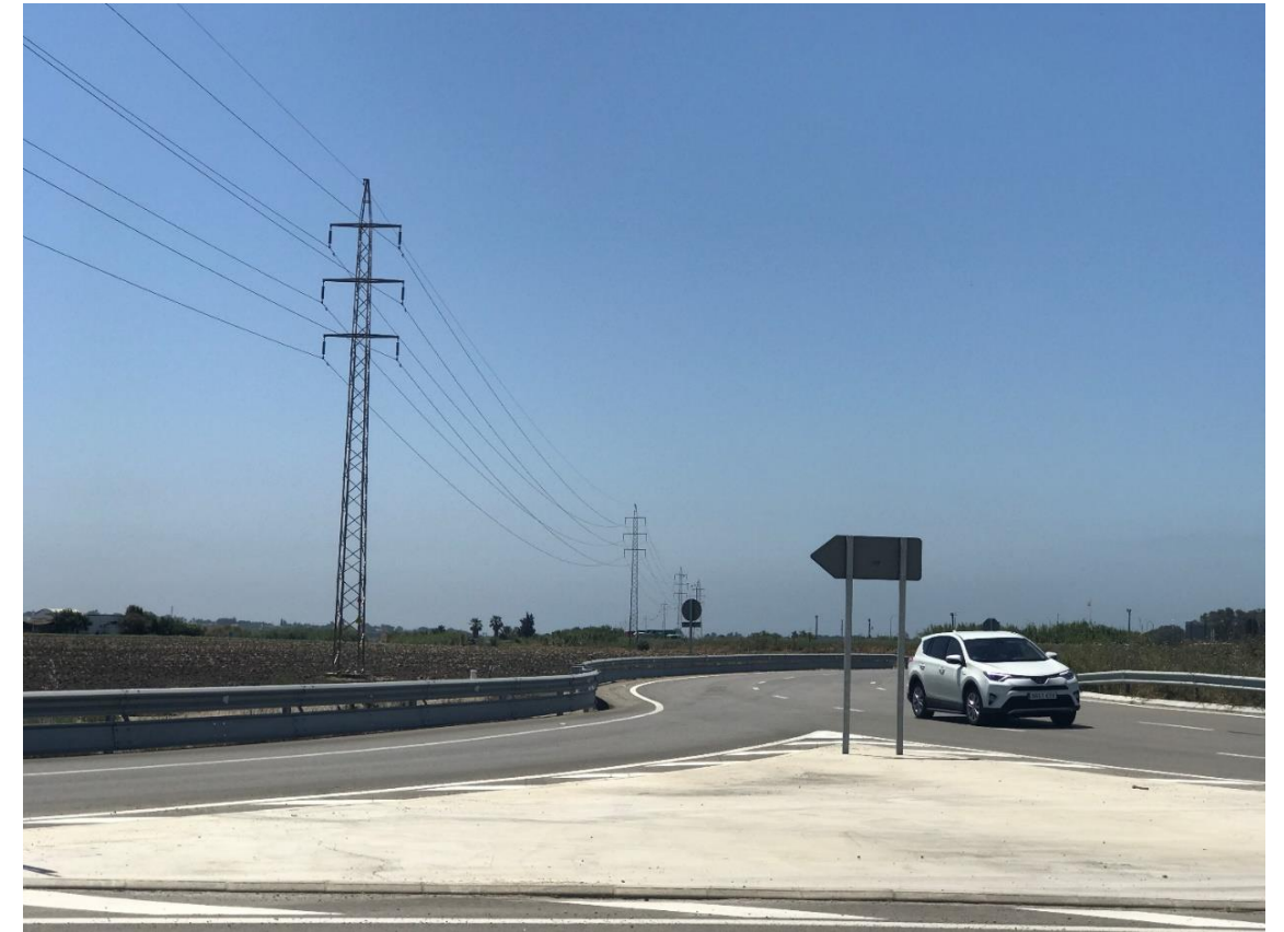
Imagen nº8. Red de distribución eléctrica vista desde Glorieta (Salida a A-2078)