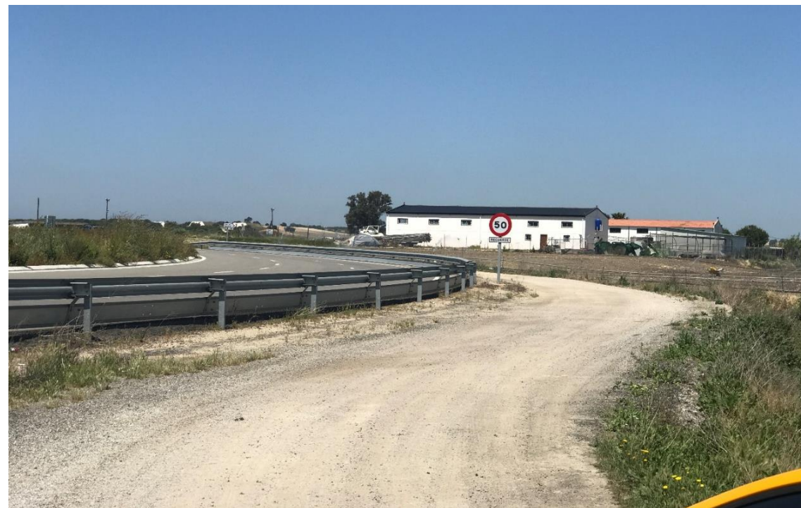
Imagen nº2. Camino sin asfaltar paralelo a la A-91